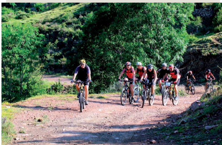
Ascensió al coll de Bas

Gran part del seu territori se situa per sobre dels 1.000 metres, amb pics que superen els 3.000 metres d'alçada. El nucli del parc està format per dues valls: a l'oest la vall del riu Sant Nicolau amb els característics prats i meandres d'on prové el nom