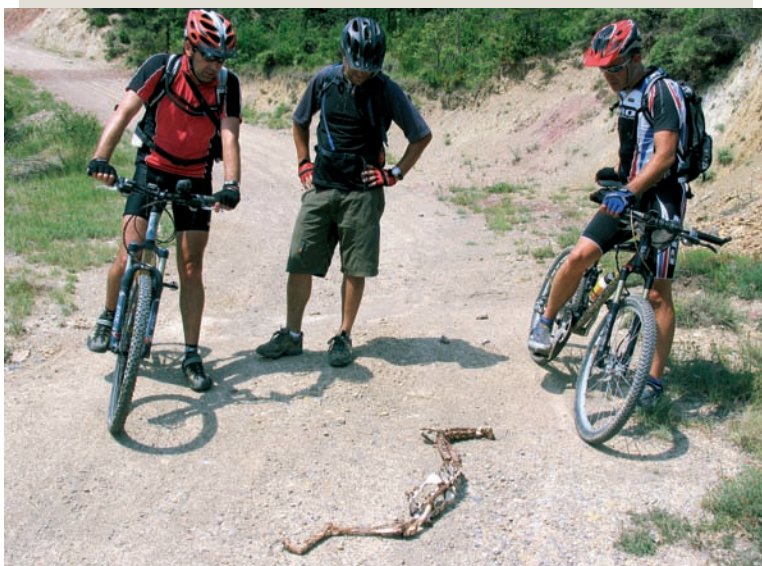
Sorpresa al mig del camí

Poc abans d'arribar a Llesp ens topem amb una de les imatges que defineix millor la tipologia d'aquest viatge; la columna vertebral i el crani d'un xai enmig d'un camí polsegós il·lustra el que és voltar per les terres altes del Pirineu molt millor que moltes sensacions acumulades a les cames dels ciclistes. La duresa de la vida a la muntanya, la desagradable sorpresa que et pot arribar en qualsevol moment en forma de tempesta, un llamp que cau, el desassossec de trobar-te sol enmig de la muntanya, la petitesa de l'ésser humà enfront la natura, la més absoluta desolació, tot plegat són imatges que em vénen al cap mentre envoltem la troballa. Hi ha un rar silenci en el grup, ningú no gosa a dir res; probablement cap dels viatgers no ens creiem més protegits que aquell pobre anyell víctima de la tempesta i dels carronyaires. El