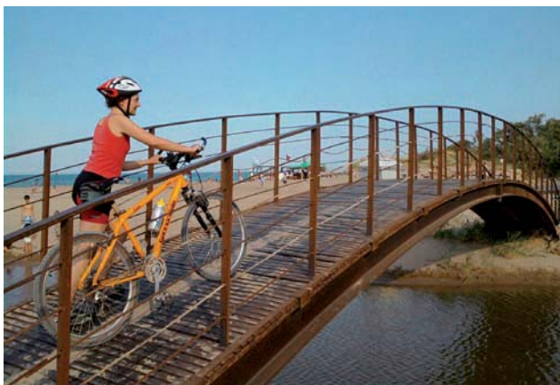
Pont sobre el Riuet

Fa uns segles, el Fluvià desembocava a l'Escala, on avui hi ha el Riuet. Per anar-lo a trobar, ens dirigirem cap al nord, a Sant Pere Pescador, un municipi que precisament deu la seva existència a la presència del riu. La ruta passa per Cinc Claus i a continuació continua per una pista ampla cap a l'Armentera, on agafarem un agradable camí paral·lel al riu des del qual es poden veure diferents espècies d'ocells. Per tornar, seguirem la platja de les Dunes. En el tram final trobarem sorra i un parell de quilòmetres en paral·lel a la carretera on haurèm de circular amb precaució. Si volem fer la ruta més llarga, podem combinar aquesta ruta amb la següent: un cop a la platja de Sant Pere, retornem al punt quilomètric 7,46 i seguim en direcció a l'Arbre Sec. En aquest cas, l'excursió sumarà prop de 40 quilòmetres.