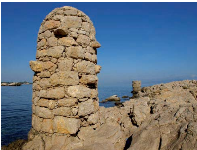
Torres per amarrar-bi embarcacions a la Punta

Sortim de les places de l'Ajuntament i de l'Església, un espai físic comú però amb dos noms, en funció de la banda