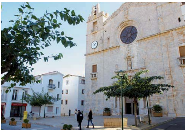
Església parroquial de Sant Pere (segle XVIII)

1954 era conegut com avinguda del Progrés i encara avui és un dels eixos més amples del poble.