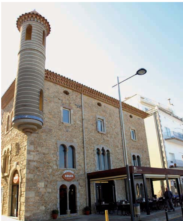
Casa de la Punxa, antiga fàbrica de gel

Solitud. En l'interior de la finca, envoltada per un mur de pedra ondulat, s'hi poden veure un estany, bancs de pedra, l'escultura L'Espinari , de Josep Llimona, un bust de Caterina Albert obra de Frederic Marès, nombrosos documents relacionats amb l'escriptora i diversos objectes grecs i romans que va trobar a les ruïnes d'Empúries.