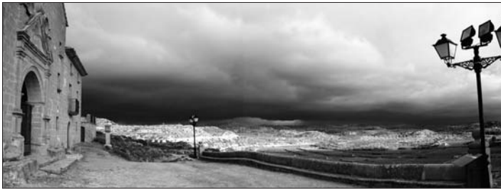
Núvols de tempesta sobre el Matarranya. Els Ports a l'horitzó.

llor conservats de la península Ibèrica. En un treball de camp de l'any 1996 es van identificar 202 espècies d'invertebrats aquàtics, com el cranc de riu autòcton ( Austropotamobius pallipes ), amenaçat per la introducció de l'americà, l'anomenat cranc roig ( Procambarus clarkii ), i 186 espècies de vertebrats. Entre totes, el que més fàcilment es pot observar són les aus, presents a tota la conca i especialment a la vora de les zones humides. Les cigonyes ( Ciconia ciconia ), els bernats pescaires ( Ardea cinerea ), els martinets ( Egretta garzetta ), les polles d'aigua ( Gallinula chloropus ) o l'àliga marcenca (àguila serpera, Circaetus gallicus ); totes aquestes espècies podrem trobar-les fàcilment en les sortides en bicicleta. En aquest sentit, el Matarranya actua com a corredor biològic entre els Ports de Beseit i l'Ebre.