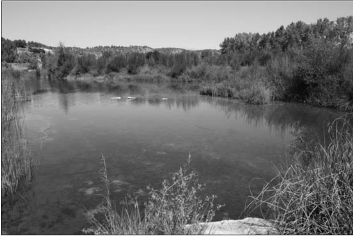
El bosc de ribera, que en alguns trams acompanya el riu, és una de les riqueses biològiques del Matarranya.

la zona més propera als Ports, amb els 550 mm anuals de Vall-de-roures, i la que s'acosta a la Depressió de l'Ebre, amb els 350 mm anuals de Massalió (municipi amb un dels índexs d'evapotranspiració més elevats d'Aragó) o els 330 mm de Nosp. A aquesta diferència en la mitjana cal sumar-li, a més, la manifesta irregularitat interanual, amb períodes de grans pluges i períodes molt secs.