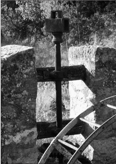
Sinya al barranc del Calapatar

A l'hora de preparar els itineraris s'han tingut en compte dos criteris fonamentals. Per una banda, que permetin obtenir una visió global aproximada del territori, tot ajudant a comprendre l'estructura del seu paisatge natural i l'activitat humana que s'hi desenvolupa i alhora permetent descobrir l'excel·lent patrimoni històric i cultural que ha generat al llarg del temps. D'altra banda, que siguin itineraris que aprofitin els antics camins rurals d'accés a masos i camps i de comunicació entre els nuclis habitats. En la seva elaboració s'ha fet un esforç per cobrir la major part del mitjà i baix Matarranya i oferir una mostra dels seus principals indrets. D'aquesta manera, es pretén afegir el plaer de la descoberta al plaer de la bicicleta.