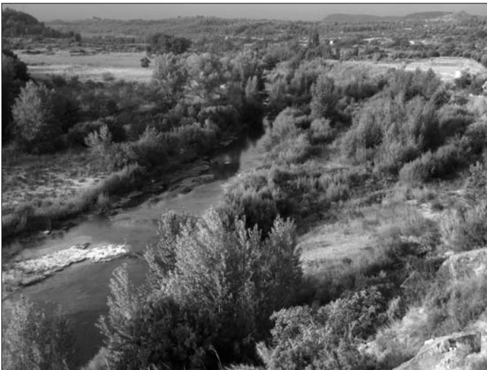
El Matarranya entre la Vall del Tormo i la Torre del Comte.

El clima de la zona és típicament mediterrani, amb tendència continental i evident progressió cap a l'aridesa a mesura que avancem cap al nord. Amb hiverns freds i estius força calorosos, que sobrepassen fàcilment els 35 graus a les zones més septentrionals ja de ple a la Depressió de l'Ebre. Pel que fa a les precipitacions, hi ha també una marcada diferència entre