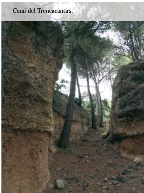
Camí del Trencacàntirs.

i l'altra, més incisiva, aplicada a la lectura dels textos de la Nati Soler, a uns versos que mantenen viu el llegat de la nostra llengua sense perdre en cap moment la modernitat i l'actualitat de l'idioma. Les dues mirades es complementen i si som capaços de mantenir les dues alhora, és possible que hàgim aconseguit penetrar en la plenitud dels Poemes de pedra seca .