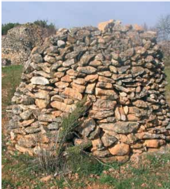
Pilona, o magatzem de pedra sobrera, al fons una barraca de planta composta (Santes Creus).

Viure a pagès havia estat sempre un exercici de relligar les ànsies pròpies amb els elements que la natura posa a l'abast. Saber utilitzar tot