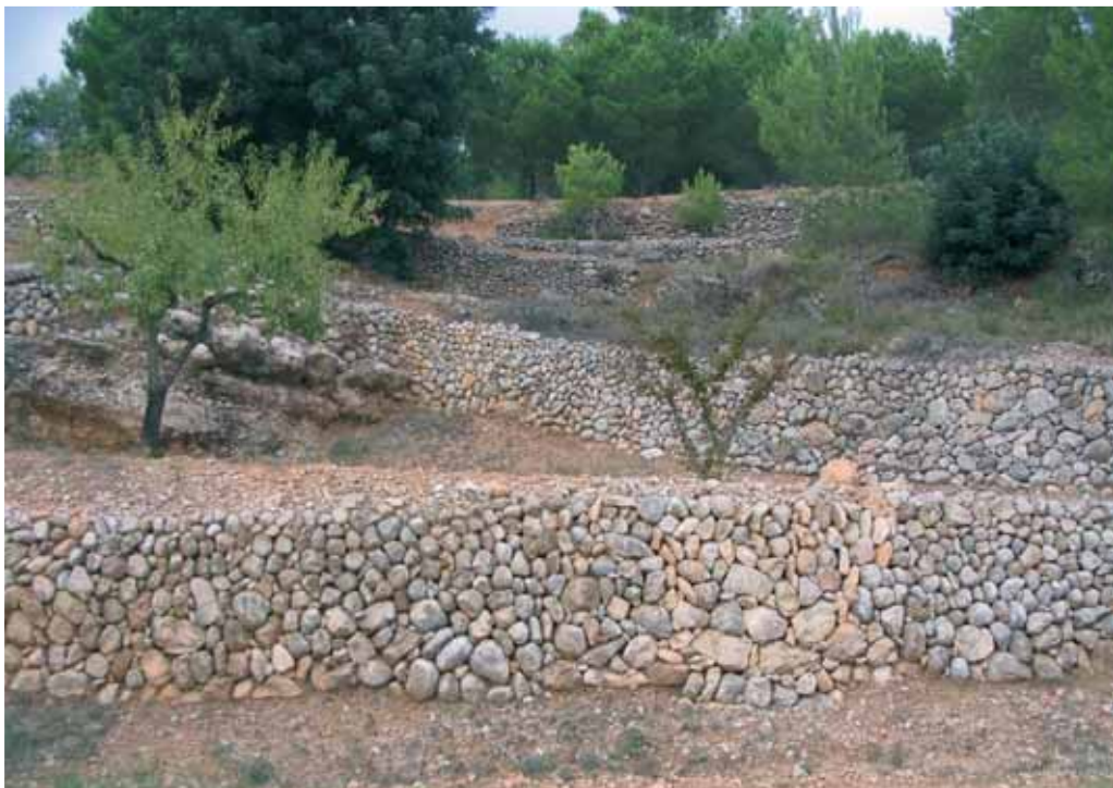
Marges formant feixes, a Cal Rotllat (la Bisbal del Penedès).

sòl fèrtil. També són útils per aprofitar els vessants de les muntanyes, formant peces de terra de conreu en forma de terrassa que reben el nom de feixes.