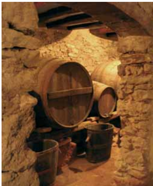
El celler de Mas Vilella.

Crec que aquest llibre es mereix ser llegit amb dues mirades coincidents: l'una, la primera, fixada en les esplèndides fotografies d'en Josep Vallès, que són un gran document gràfic,