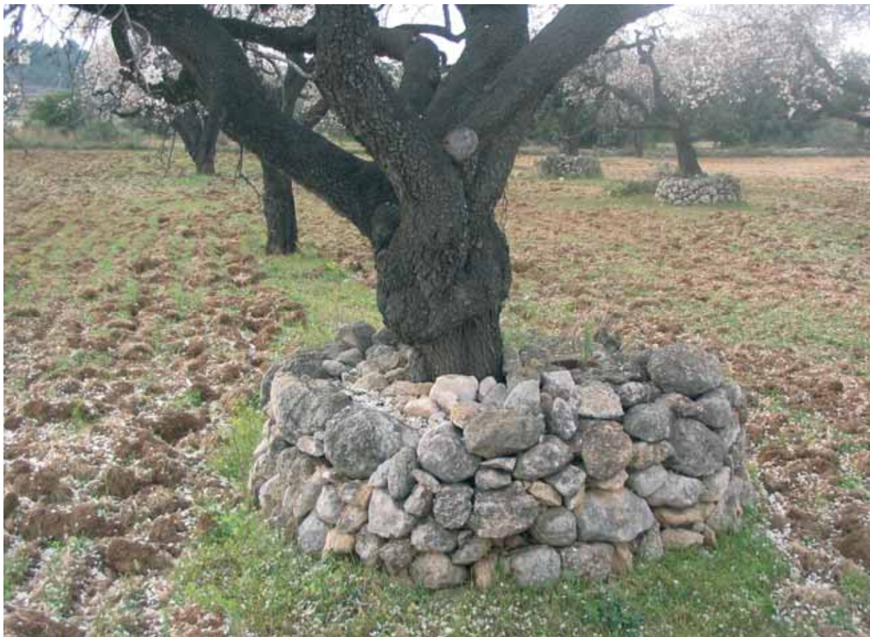
Vells ametllers florits a Cal Xico (la Bisbal del Penedès), protegits amb trones de pedra seca.

les branques dels arbres que corren risc de trencar-se, a causa de l'excés de pes d'una abundosa producció de fruits, o bé denoten una fragilitat clara per culpa de qualsevol agressió o carència.