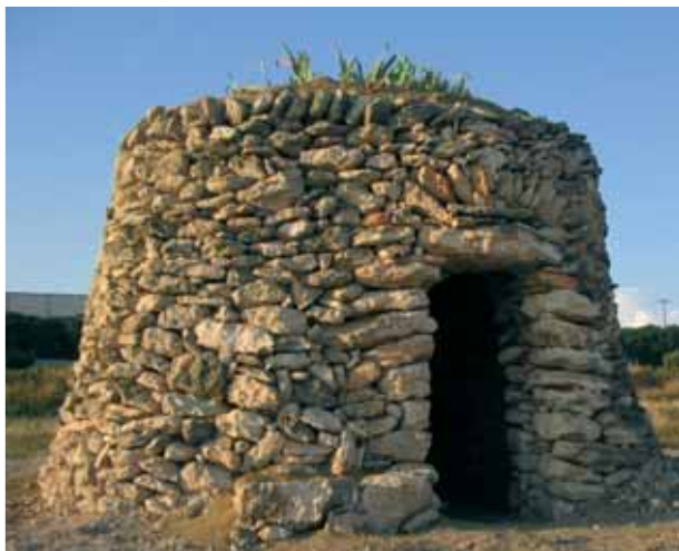
Barraca troncocònica amb pedrís, portal de doble llinda plana i arc de descàrrega, reconstruïda dins el recinte d'una empresa a Saifores (el Baix Penedès).

el que es té, des dels fruits més aparents fins a les propietats més sorprenents d'herbes menudes i d'aspecte insignificant.