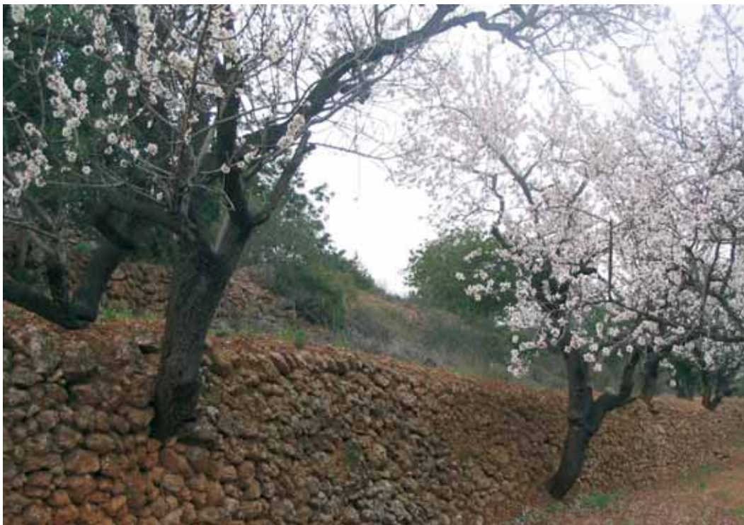
Ametllers florits calçats dins d'un marge per aprofitar el terreny de conreu.