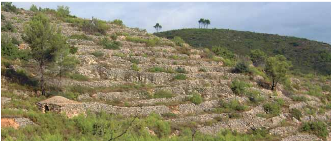
Marges i barraques, paisatge humanitzat. Torrent de Mas Bartomeu (el Montmell).

d'impediments que ara ens resultarien tan incomprendibles com la manca de mitjans de comunicació i de transport.