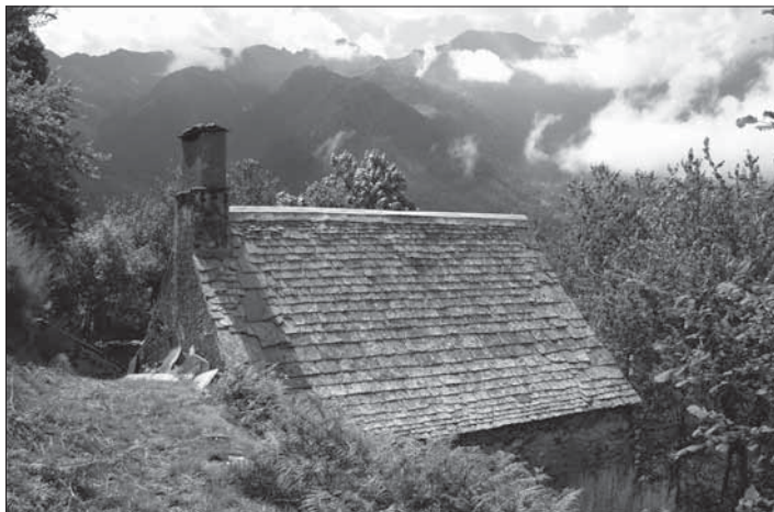
Casa de Campespin

Superat un barranquet, per on llisca un petit rierol, passem un tram preciós aixoplugats entre roures i freixes, amb algunes construccions caigudes. De fet, ja som al caseriu de Campespin , on no fa gaires anys encara hi havia una casa habitada.