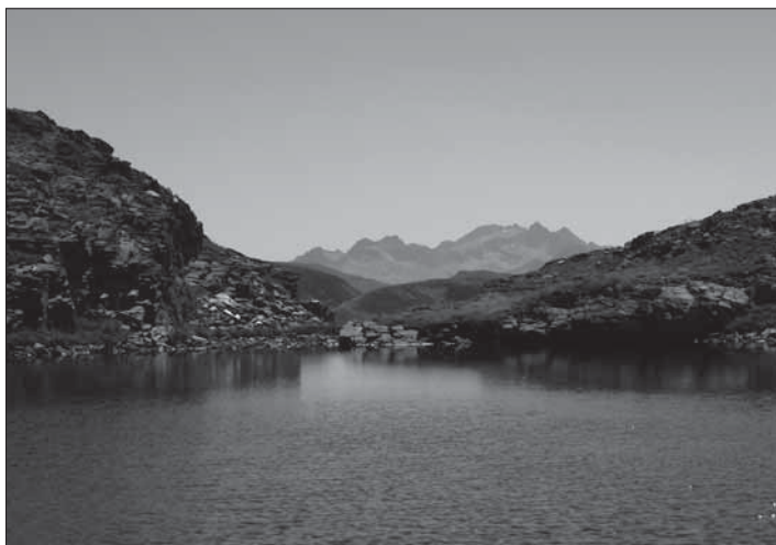
Estanhet deth Pòrt d'Arbe

Sant Joan de Toran és un cas emblemàtic. Va ser restaurat ja fa bastants anys amb un respecte absolut per les formes de construcció tradicional, segons uns criteris totalment diferents als que imperen en la resta del territori aranès, cada dia més despersonalitzat. El resultat és un poblet bellíssim, que conserva les essències del passat i que ara pot projectar-se cap al futur. Potser podria ser un model de referència per a futures restauracions d'altres poblets, ja que és impensable la recuperació dels antics modes de vida.