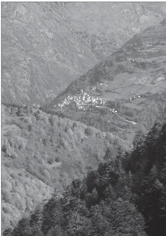
Vista de Canejan

propostes per descobrir aquesta primera zona de la Val de Toran d'una manera variada i força completa. Canejan, per tant, no és només el final d'una visita en cotxe, sinó també el punt de pas i de partida de magnífiques excursions que multiplicaran les perspectives d'aquest poble-mirador.