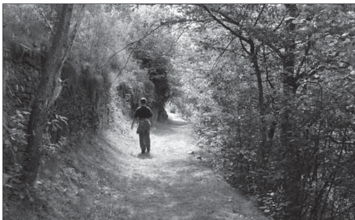
Camí dera Cau

0 h 45'. Canejan. Plaça de Castra, davant de l'Ajuntament. Agafem el carrer i després camí d'Era Cau, que duu a Porcingles. Després d'una curta pujada pel costat d'unes bordes, es