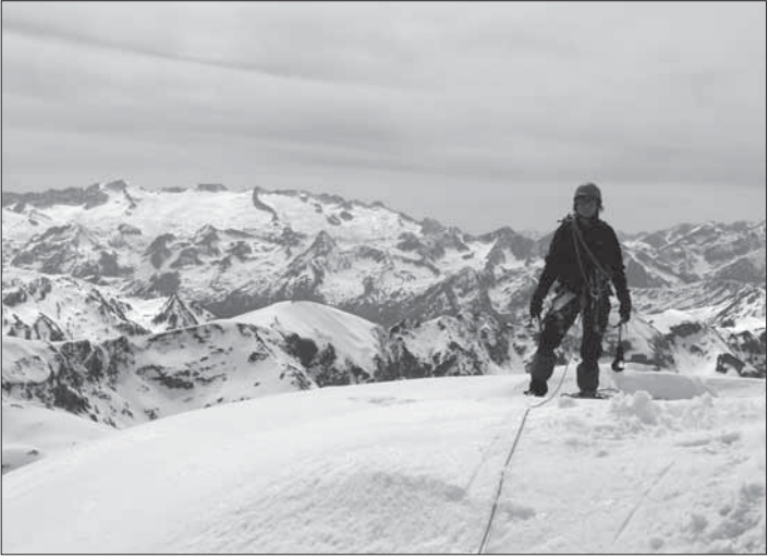
Sortida de la canal Era Trauèssa

És en aquest darrer punt on s'inscriu la nostra guia, tenint en compte els altres dos altres aspectes comentats. Amb el nostre treball, voldríem contribuir a ampliar el coneixement de les muntanyes de Canejan en l'àmbit excursionista, sense cap por que això suposi malmetre el seu encant o pugui ser causa d'algun deteriorament. Al contrari, ja que estem convençuts que aquells que van a veure el paisatge natural o humanitzat caminant són els que més el respecten i els que més s'afanyen a conservar-lo. Si hi ha excursionistes, els camins no es perdran i es desvetllarà —n'estem convençuts— una profunda estimació per un dels entorns més ben conservats del nostre país.