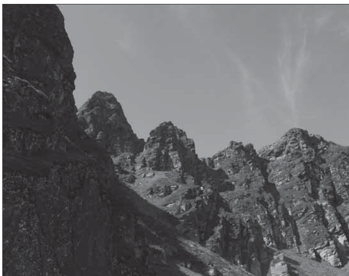
Malhs dera Pala deth Gesp