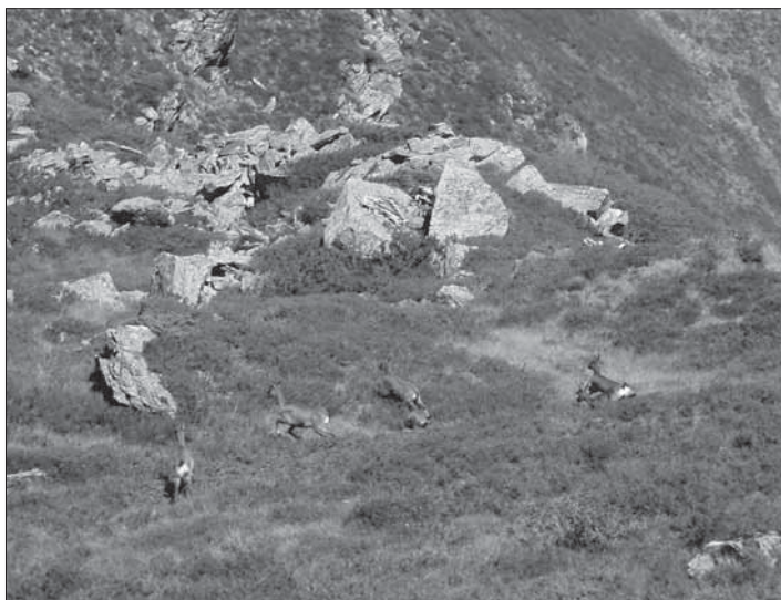
Isards sorpresos a Era Toa des Cobos

Toran possiblement té la més gran riquesa de fauna i flora de tota la Val d'Aran, ja que és el territori més extens d'aquesta comarca que no està explotat en l'àmbit ramader i que presenta menys intervencions urbanístiques. La fauna major (óssos, senglars, etc.) només és perillosa quan se sent amenaçada. Cal anar amb compte a l'hora d'atansar-se massa als cérvols en època de zel (tardor), perquè, encara que no fugen, tenen un instint agressiu. L'únic animal veritablement perillós és l'escurçó (el que hi ha al Toran és l'escurçó pirinenc, la Vipera aspis ), que pot picar si es trepitja o se sent acorralat. D'escurçons n'hi ha gairebé a tot el Pirineu; però com que molts itineraris que proposem no passen per camins fressats, cal vigilar per on es trepitja.