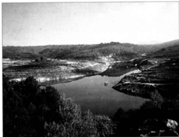
El pantà de Galà

l'esquerra i passem per davant de l'església, tot deixant la plaça a l'esquerra, i seguim el carrer de Sant Roc que marxa a la nostra dreta.