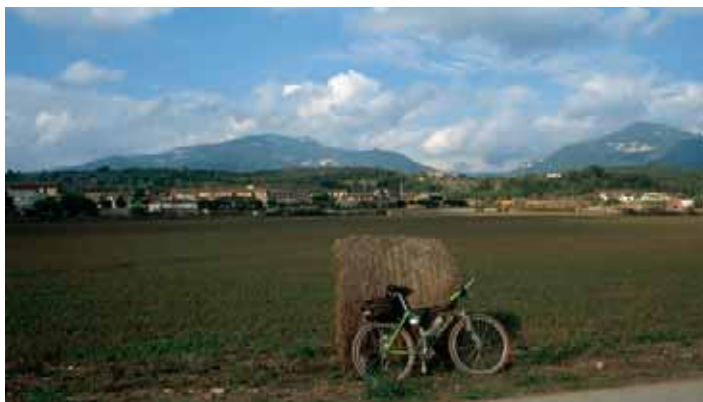
Paisatge dels afores d'Argelaguer (les muntanyes de l'Alta Garrotxa al fons)

En canvi, parlant en termes generals, trobem un conjunt amb una forta pluviositat que presenta un règim entre els 900 mm anuals a les valls centrals i els 1.500 mm als punts més enlairats, tant al nord com al sud. La barreja, doncs, de components mediterranis, subalpins i fins i tot atlàntics permet gaudir d'una vegetació rica amb grans masses forestals, on destaquen els alzinars, les rouredes i les fagedes.