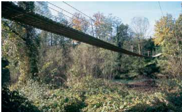
La gran passarel·la sobre el riu Ter

11,61 km. Font de Torrents (920 m). Continuem recte i a 150 m