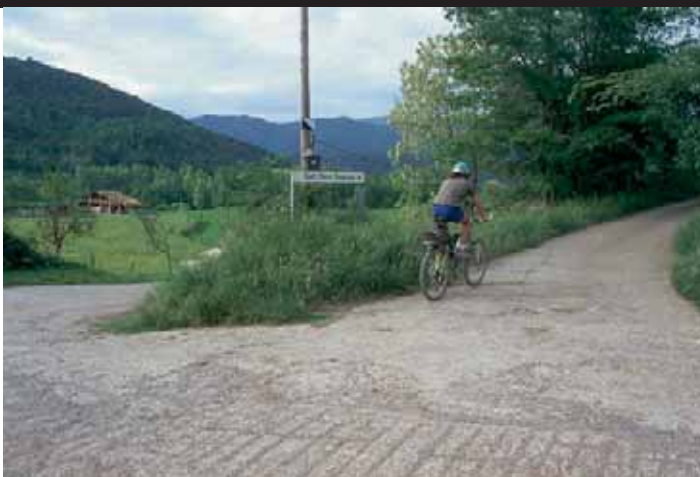
Accés a l'església de Sant Pere Despuig

per la carretera, passat el nucli de la Canya arribaríem en 2 km fins a la població de Sant Joan les Fonts, on trobem l'anomenada Ruta de les Tres Colades, bonic itinerari per fer a peu i descobrir unes espectaculars cingleres basàltiques a la vora del riu Fluvià i la confluència amb la riera de Bianya. Accedim, doncs, a l'espai del parc natural de la Zona Volcànica de la Garrotxa.