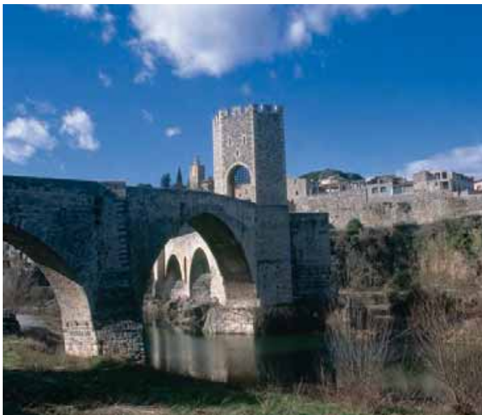
El pont vell de Besalú