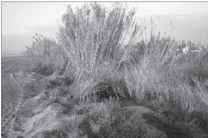
Aspecte de les Madrigueres, arran de platja.

Ens acostem un moment a xerrar amb un pescador i ens interessem per com li ha anat la pesca fins ara. Ens diu que avui res de res, que ara a l'hivern és qüestió de molta sort, que fins d'aquí a un parell de mesos no és bona època per a la pesca. Hi afegeix que tot i que no s'agafa res, el dia que hi ha sort el peix és gros.