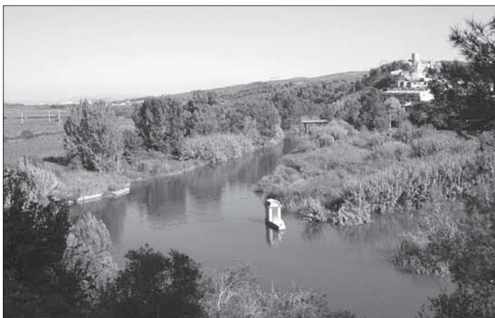
El riu Foix a Castellet.

El relat de tal i com ens van anar les coses en una determinada data pot ser molt útil per als lectors del present treball que vulguin fer cadascuna de les caminades. Tot i que en repetir la ruta en una data similar d'un any posterior al narrat ens puguem trobar amb certs canvis, hi haurà moltes coses que encara s'hi mantindran. Així doncs, possiblement hi podrem trobar la majoria de les plantes que nosaltres hi hem descrit. Dels animals, si estem atents, també en podrem reconèixer alguns. Lògicament moltes coses hauran canviat, ens podrem trobar amb rastres que aleshores no hi eren, potser els ocells cantaran més o potser menys, trobarem plantes noves, algunes que surten al text pot ser que hagin minvat... No hi ha dos dies iguals a la natura, i per tant molts elements són imprevisibles.