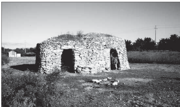
Barraques bessones.

Uns metres més enllà el carrer es transforma en camí de carro. Deixem la urbanització. Ara al nostre entorn hi ha els garrofers treballats.