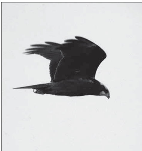
L'arpella és una au rapinyaire que es pot veure durant els passos migratoris.

Hi ha una de les sortides que es fa amb barca. És la del mes d'agost. Tot i que és un tipus molt diferent d'itinerari, ens ha semblat interessant d'incloure'l perquè ens dona la possibilitat de conèixer la vida que hi ha a poques milles de les nostres costes. Sabem que d'entrada no és fàcil d'organitzar aquest tipus de sortides, però val la pena d'intentar-ho. La realització de la resta de caminades no ens han de suposar cap mena d'entrebanc. En general transcorren per bons camins i com a molt en algun moment hi ha pendents més drets.