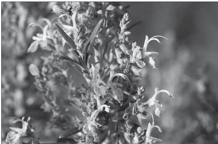
El romaní es pot trobar florit gairebé tot l'any.

admirar la feina que antany van fer els habitants de la contrada (des de les barraques de pedra seca fins als castells i ermites), contemplar la bellesa dels dibuixos que formen els núvols, restar uns instants a l'aguait per tal de sorprendre algun animaló... I com aquestes, moltes altres coses que ens faran allargar o escurçar el temps que vulguem esmerçar en fer el recorregut. La nostra recomanació és de dedicar-hi com a mínim tot un matí, si pot ser des de trenc d'alba.