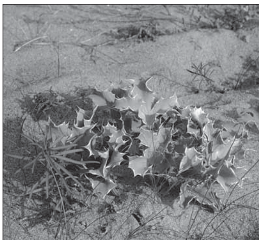
Rave marí (a dalt) i panical marí, molt escàs a la platja de les Madrigueres.