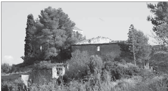
L'església de Sant Sadurní és a l'inici de l'itinerari.

Comencem la ruta al costat mateix d'aquesta església. De la part nord en surt un camí de carro, que just a una cinquantena de metres, ens porta fins a una petita pedrera abandonada. El terreny està molt amarat d'aigua.