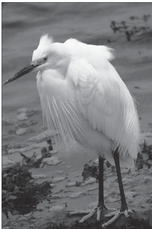
Martinet blanc.

els veritables culpables són els qui han eliminat les dunes i han permès una mala urbanització del litoral.