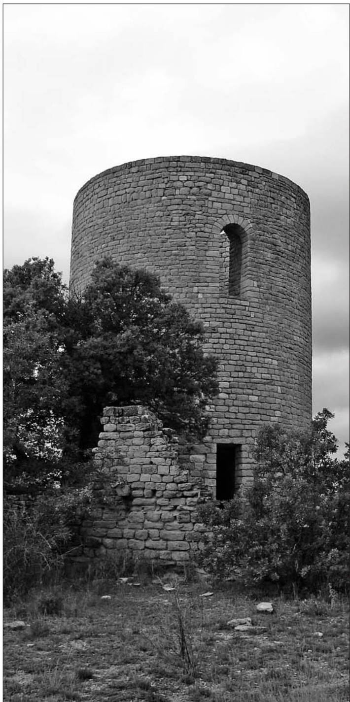
Torre de Cas