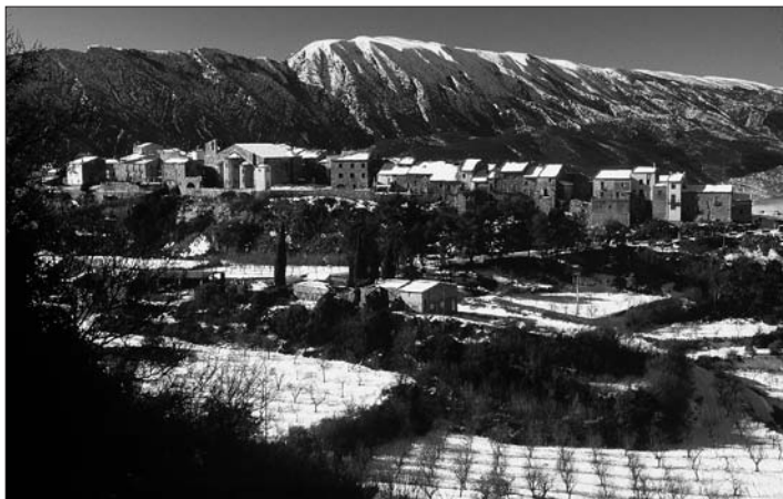
Montsec de Rúbies i Llimiana

Les fonts són relativament abundoses, però la major part de les existents a la part alta de la muntanya s'han perdut a causa de la sequera i de l'abandonament. Per donar només uns exem-