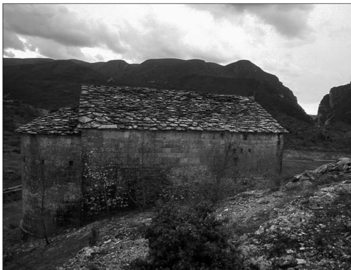
Mare de Déu del Congost