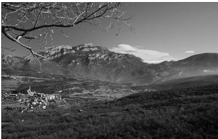
Àger, Montsec, Sant Mamet i Coll d'Orenga