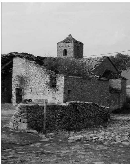
Girbeta. Senyalització del camí de Nostra Senyora del Congost

1 h 30'. Primeres cases de Montgai (854 m), poble arrambat a un característic cingle. Només resta un carreró, que actualment és ple de bardisses i pedres que han caigut de les cases. Si volem ser pràctics, és millor descendir al proper camí carreter que hi ha a l'esquerra. La majoria de cases estan enrunades i això provoca una profunda malenconia. Resta encara alguna casa dempeus, però és especialment interessant l'esglésiola romànica sota l'advocació de la Puríssima. Seguim la pista amunt, creuem un camp que constitueix una collada (886 m) entre el barranc de Montgai (a l'est), que drena directament a la Noguera Ribagorçana, i el de Romaní, que per l'altre vessant va al barranc de la Llitera. En aquest punt ens incorporarem en davallar del cap del Montsec. Prenem un camí carreter que baixa cap al barranc de Romaní. En un primer moment podem prendre un tram del vell camí que descendeix per l'esquerra i fa dreuera.