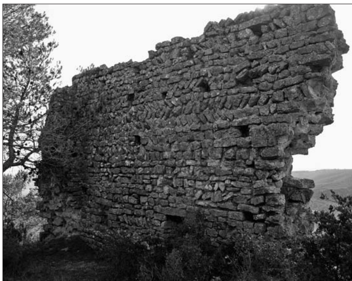
Pany amb opus spicatum del castell de Font-rubí.

Els francs pretenien consolidar-se al Migdia francès per disposar d'accés a la Mediterrània. Per això calia construir un tap que servís de defensa contra les incursions andalusines. Així va sorgir la Marca Hispànica, una frontera militar amb un entramat polític configurat per comtats i capitanejats per Barcelona, una ciutat que es va incorporar als francs el 801.