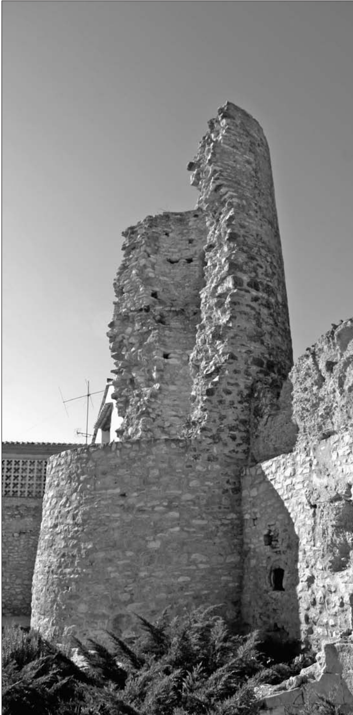
La torre de Lletger després de la restauració.