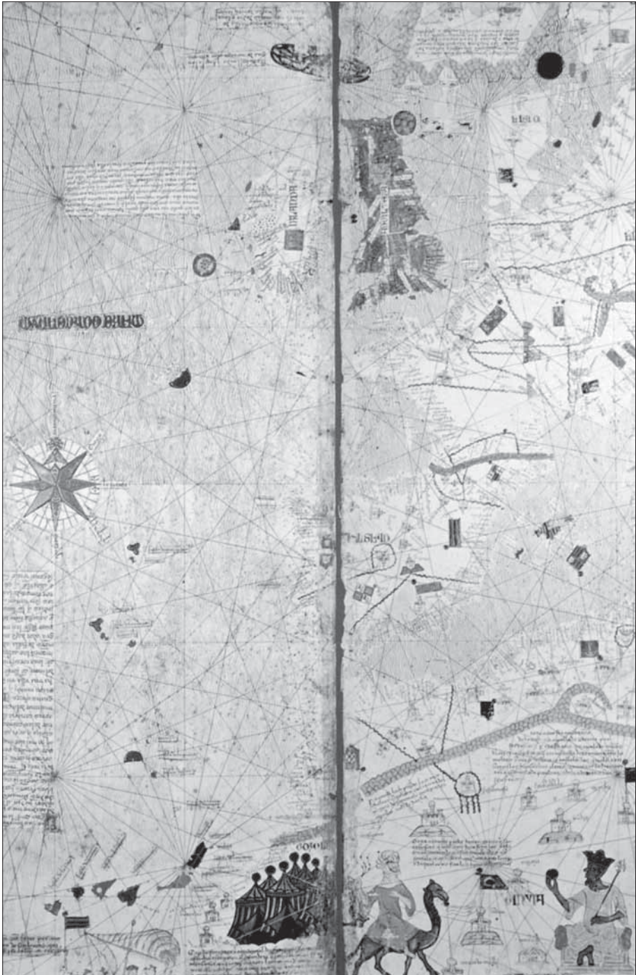
Atles de Cresques Abraham, editat el 1375.