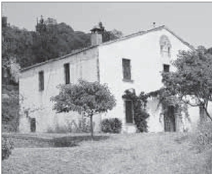
Casa Nova de Pibernat