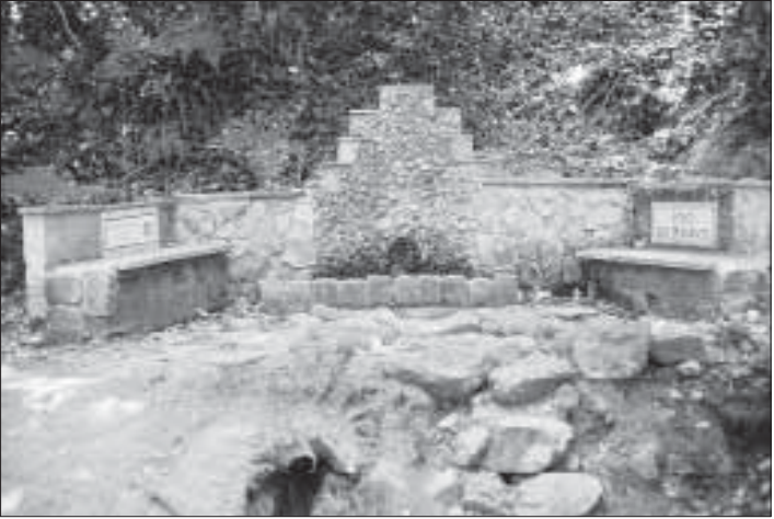
Font del Perdigot