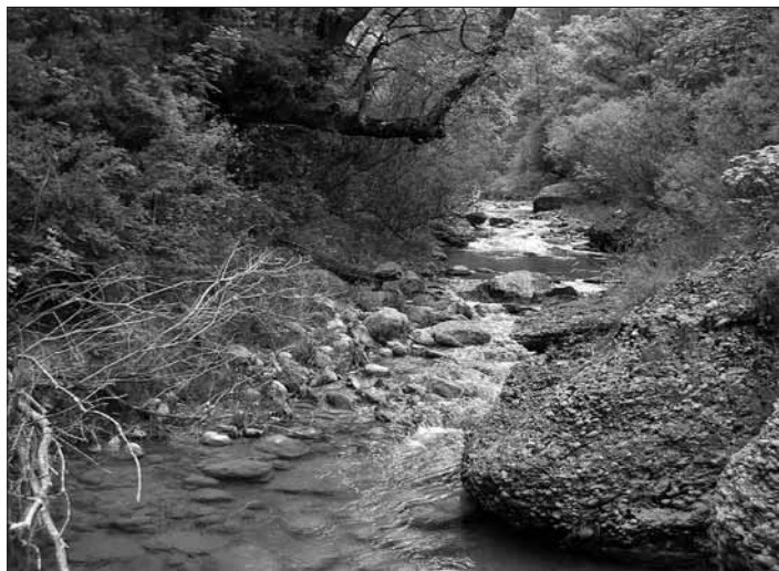
Riu de Canalda

Al Solsonès, aquests conglomerats constitueixen una formació singular. Fan una franja de fins a vuit quilòmetres d'ample que travessa la comarca de punta a punta i en part van ser empesos amunt per les forces tectòniques mentre s'anaven dipositant. A la conca de la Ribera Salada, tots els rius hi han excavat congostos amb estrets engorjats, que emmarquen llargs serrats i vigoroses esqueses d'ase. A l'altra banda de la serra d'Encies, dins la conca del Cardener, l'efecte de les pressions