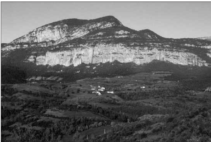
Puig Sobirà de Canalda

El Solsonès queda ben delimitat al nord per la primera gran alineació dels Prepirineus centrals catalans. La formen aquí, d'est a oest, les serres del Verd i de Port del Comte. Són dues muntanyes diferents, en la història geològica, en els materials i en el relleu. Atenent al relleu, el Verd és un massís de cims ben marcats. S'hi destaquen el cap d'Urdet, el cap del Verd, la roca d'en Carbassa i la roca del Migdia, i a partir d'aquest punt ja enllaça amb el Port del Comte en el coll de Port o de Tuixén. El Port