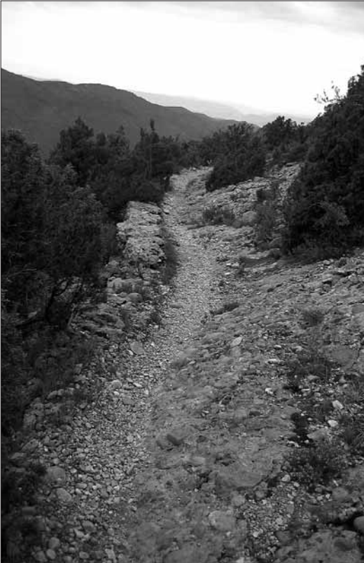
El Passiró, camí medieval d'Oliana a Cambrils

Tots els trenta-cinc itineraris proposats són circulars, i la majoria fàcils de seguir en condicions normals. Si hi ha cap dificultat especial, s'indica a l'itinerari. En general, els que recorren la línia que va del Verd al Port del Comte no s'han de fer a l'hivern, quan la neu hi pot ser abundant, i els que s'endinsen pels indrets baixos i les rases serà millor ajornar-los els dies de calor forta, no solament dins el període estival, i també els dies de boira, a l'hivern. En aquests llocs i més especialment a les parts altes, fins al Port del Comte, no hi és pas rar l'escurçó, en marges assolellats de bosc humit, munts de roques o mates grosses, d'abril a octubre. La durada s'ha calculat caminant a pas seguit i sense parades. Per això cal pensar a dedicar una jornada sencera a les excursions de més de quatre hores. Alguns itineraris proposen variants, per disposar d'alternatives o per arrodonir la caminada visitant punts interessants fora del recorregut, i abunden les indicacions perquè un mateix se'n pugui fer de nous. Una curta introducció subratlla les característiques i l'interès del lloc, amb aspectes desenvolupats en els apartats d'aquesta introducció.