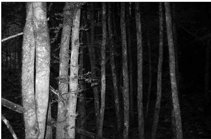
Detall de la Boixeda de Valielles, potser la més desenvolupada de Catalunya

El poblament s'ha estructurat en bona part en masies disseminades. L'eixutesa del clima, a la zona baixa, i el relleu difícil, a la zona de muntanya, no permetien grans rendiments ni