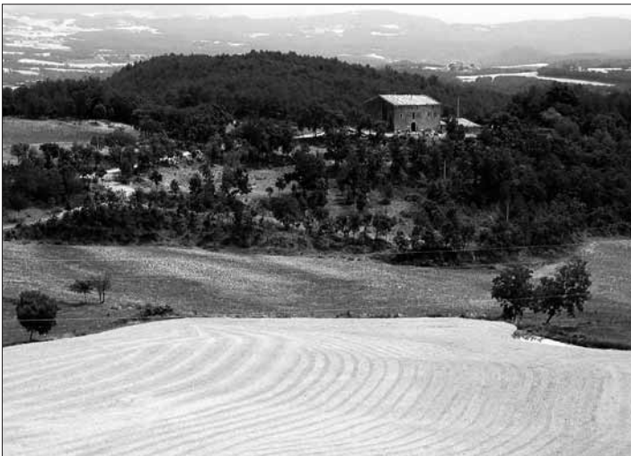
Masia del pla de Navès

L'àmbit de la present guia és el sector muntanyós del Solsonès, o alt Solsonès, que va de la ratlla de Solsona fins als primers grans relleus dels Prepirineus. Al capdamunt d'aquest sector s'eleven cims tan destacats del punt de vista excursionista com el cap del Verd, el pedró dels Quatre Batlles, el Puig Sobirà de Canalda o el cogulló de Turp. Davant seu, els conglomerats que s'apilen a les vores de la Depressió Central formen un complex de cims i fondalades de gran espectacularitat i atractiu geològic. Les serres dels Bastets, Busa, Lord o les Encantades i els engorjats del Pont Quebradís, Escales, Vilamala, Canalda o la Ribera Salada mostren com enlloc els trets distintius de les formes del relleu en conglomerat, ben diferents de les que caracteritzen la roca calcària. La vall de Lord, situada entre les dues zones, apareix com un autèntic monument natural. Ja als serrats inferiors, extensions generoses de terra campa, amb masies ben posades, configuren un paisatge rural que es fa mi-