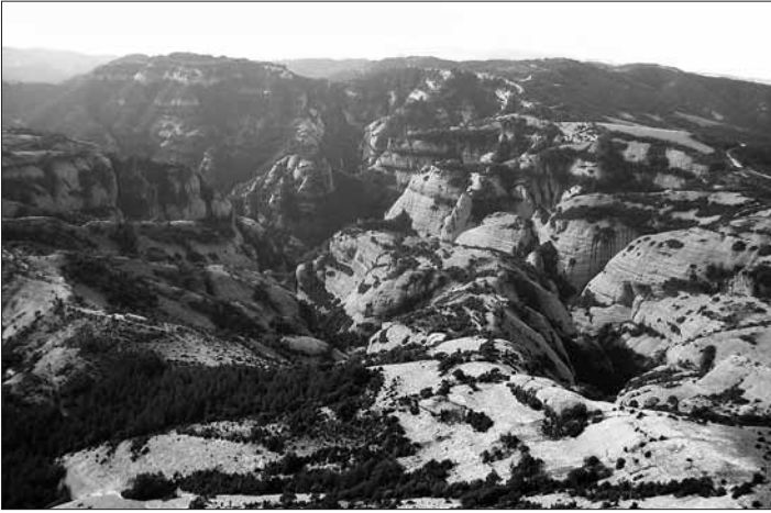
Clot de Vilamala, tancat al fons pel tossal de la Ventolana

del Comte, en canvi, és més que res un massís d'ondulacions i calmes d'altura pesants i monòtones. Enmig d'aquests tossals sobresurt lleugerament el denominat pedró dels Quatre Batlles, la màxima elevació de la comarca (2.382 m). Des del Pedró, el Port del Comte pren direcció sud-oest en la serra de Campelles, llarga d'uns set quilòmetres, i es torna a aixecar en el tossal de Cambrils. A cada punta d'aquest eix s'hi arrecera una vall penjada, la del Montnou i la de Cambrils. Per migdia, el massís cau espadat en el puig de les Morreres, té un important estrep en el Puig Sobirà de Canalda i se'n desprèn una nevadura que va perdent altitud fins a sobre mateix de Solsona. Aquesta línia muntanyosa, amb el tossal de la Creu del Codó, la serra d'Encies, la serra de Prat d'Estagues o l'alt pla de Riard, separa les aigües en les conques del Cardener i el Segre. Tanquen la vall de Cambrils els primers estreps de la serra de Turp, que s'abat sobre el Segre, ja a l'Alt Urgell. Ben a l'est, el Solsonès fa també un entrant en la serra d'Ensija, a la ratlla del Berguedà.