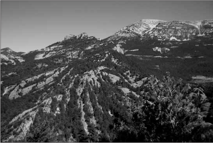
Discordances progressives del Codó

calcàries, dolomies i margues del juràssic i del cretaci superior i de retalls de guixos i dolomies del triàsic, i presenta formes més enèrgiques. Al límit meridional del Port del Comte, les calcàries eocenes encavalquen conglomerats oligocens formant el Puig Sobirà de Canalda. Per contra, aquestes roques fossilitzen amplis vessants de la serra del Verd, i són relíquia de la capa d'arrossegalls que en algun moment devia recobrir el Pirineu solsoní. L'aigua de Valls hi ha retallat els espectaculars cints de Can Blanc i de la Torre i a sota excava els engorjats del Pont Quebradís, no pas menys vistosos. En amplis sectors del massís, les calcàries han estat modelades per l'aigua de pluja en rasclers i força disgregades sota les condicions periglaciàries del quaternari. Aquests materials fragmentats fan deserts de pedra a les parts summitals, s'acumulen als vessants i formen cons de dejecció, com el que va dels flancs del puig de les Morreres fins a Sant Llorenç de Morunys. Al peu de la serra del Verd, a la vall de Lord, el Cardener ha deixat al descobert un petit fragment de l'extrem meridional del mantell del Cadí, format aquí per margues; els guixos que hi afloren intercalats donen nom al veïnat de Guixers i avui s'exploten activament.