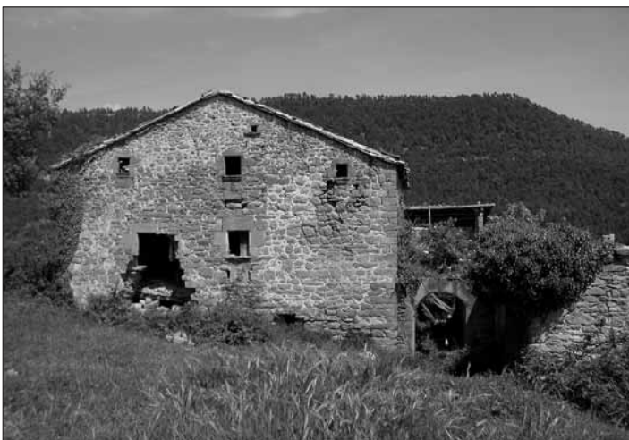
Parcerissa, casa de característiques típicament solsonines