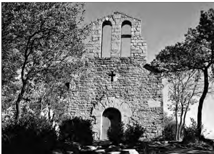
Sant Feliuet de Savassona

grans roques, on normalment hi ha grups de joves que practiquen l'escalada. A banda dels senyals de GR i PR, en trobarem uns de verds que marquen el "Sender Feliuet". Un d'aquests ens indica el camí cap a la Pedra del Sacrifici i allà ja trobarem el senyal que ens marca el camí cap a l'ermita. Aquestes roques, entre les quals hi ha la Pedra del Sacrifici, la Pedra de les Bruixes i la Pedra de l'Home, ara ben restaurades i amb plafons explicatius, formen part d'un gran jaciment arqueològic.