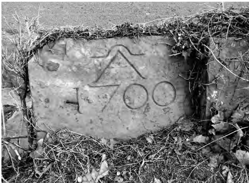
Inscripció al mas Pla de Balenyà (Osona).

En el cas de la font de Castellar de Dalt (Sant Martí de Centelles, Osona), on hi ha la inscripció «Bega qui Wlga mentres ni aja 1767» ('begui qui vulgui mentre n'hi hagi, 1767'), el missatge no és només que es pot beure aigua de la font, sinó que els propietaris de la masia tenen el poder de decidir donar part d'aquesta aigua a qualsevol persona, i que així ho han fet des de fa dos segles i mig. També en aquesta casa hi havia plantats quatre xiprers, que significaven que s'hi acollien tant homes com dones, que tenien dret a passar-hi la nit i a un àpat complet. 3 Una cosa semblant es pot dir de l'escrit que es troba a la bassa de la mateixa masia, 4 de la qual en tenim prou amb l'expressió ha fet escurar per saber qui exercia el poder en la relació