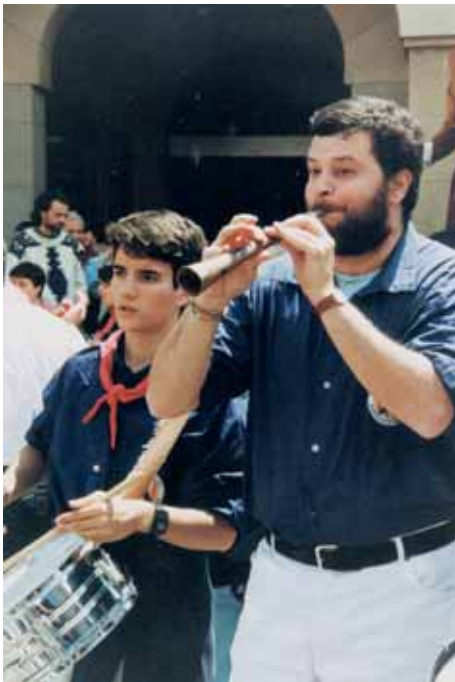
En Pastoret fou el primer responsable de la música a plaça

concerts després dels dinars de germanor. I, sobretot, la celebració final de les grans diades quan, a petició de la canalla enfilada a les espatlles dels més grans, s'interpreta El Bequerero , l'himne oficiós de les Santes i difós com a tal pels Capgrossos arreu del país, sobretot arran de les participacions al Concurs de Tarragona on, minuts abans de començar la conta-sa, centenars de mataronins i maresmencs entraven a la plaça de braus cantant la coneguda tonada i comptant fins a quinze!