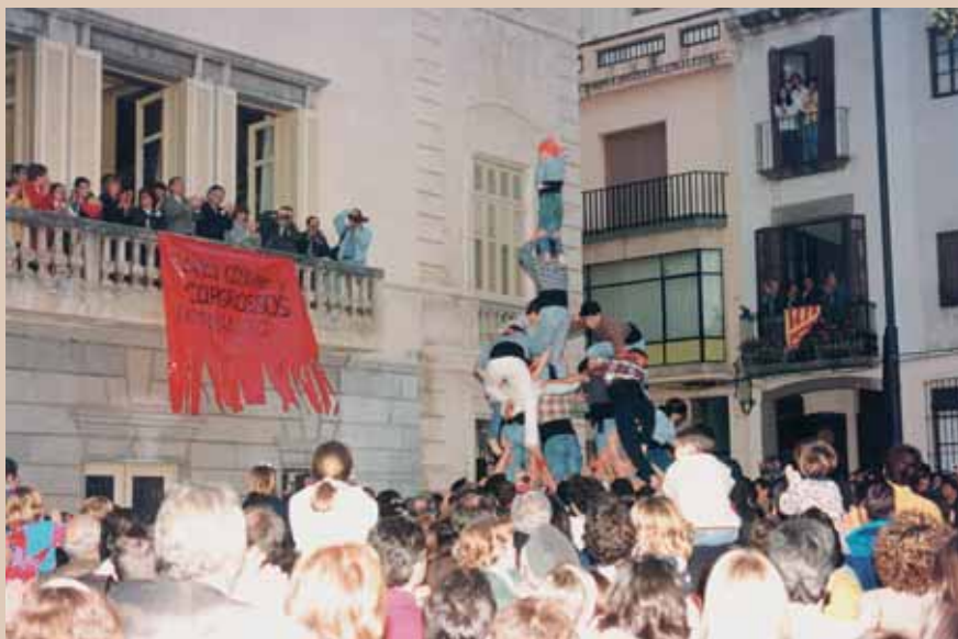
L'assaig públic per la diada de Sant Jordi acabava convertint-se en tota una actuació (Mataró, 23/04/1996)

entre castell i castell, la primera actuació amb camisa oficial en una festa de barri i, fins i tot, actuar fora de la ciutat abans de presentar-se oficialment. En contrast amb la serietat tècnica que els responsables inculcaven des d'un principi als seus castellers, a hores d'ara sorprèn la poca cura i criteri, irreverència si es vol, amb què s'enfocaven altres aspectes de caire més litúrgic, els protocols i rituals propis d'aquell nou món que la gran majoria d'aquells novells castellers i castelleres desconeixia gairebé per complet.