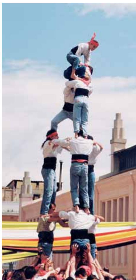
Encara sense el vestuari definitiu, es realitzava la presentació (no oficial) dins la Fira d'Artistes de la plaça de Cuba (Mataró, 12/05/1996)