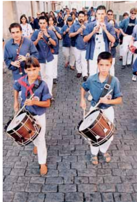
Els grallers en una cercavila l'any 1999