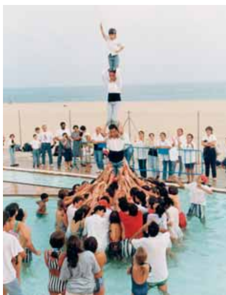
La campanya «Mulla't per l'esclerosi múltiple» deixava la imatge insòlita d'un pilar passat per aigua (Mataró, 29/06/1996)