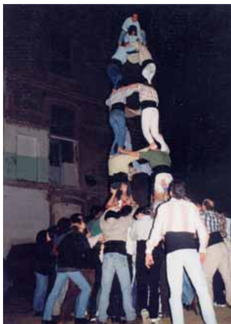
A mitjan març s'assolia el primer quatre de sis entre els cotxes del pàrquing de Can Marfà