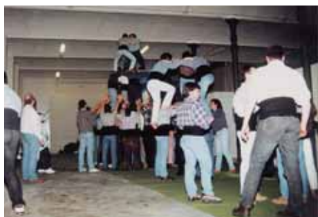
Can Marfà acollia els primers assajos de la incipient Colla