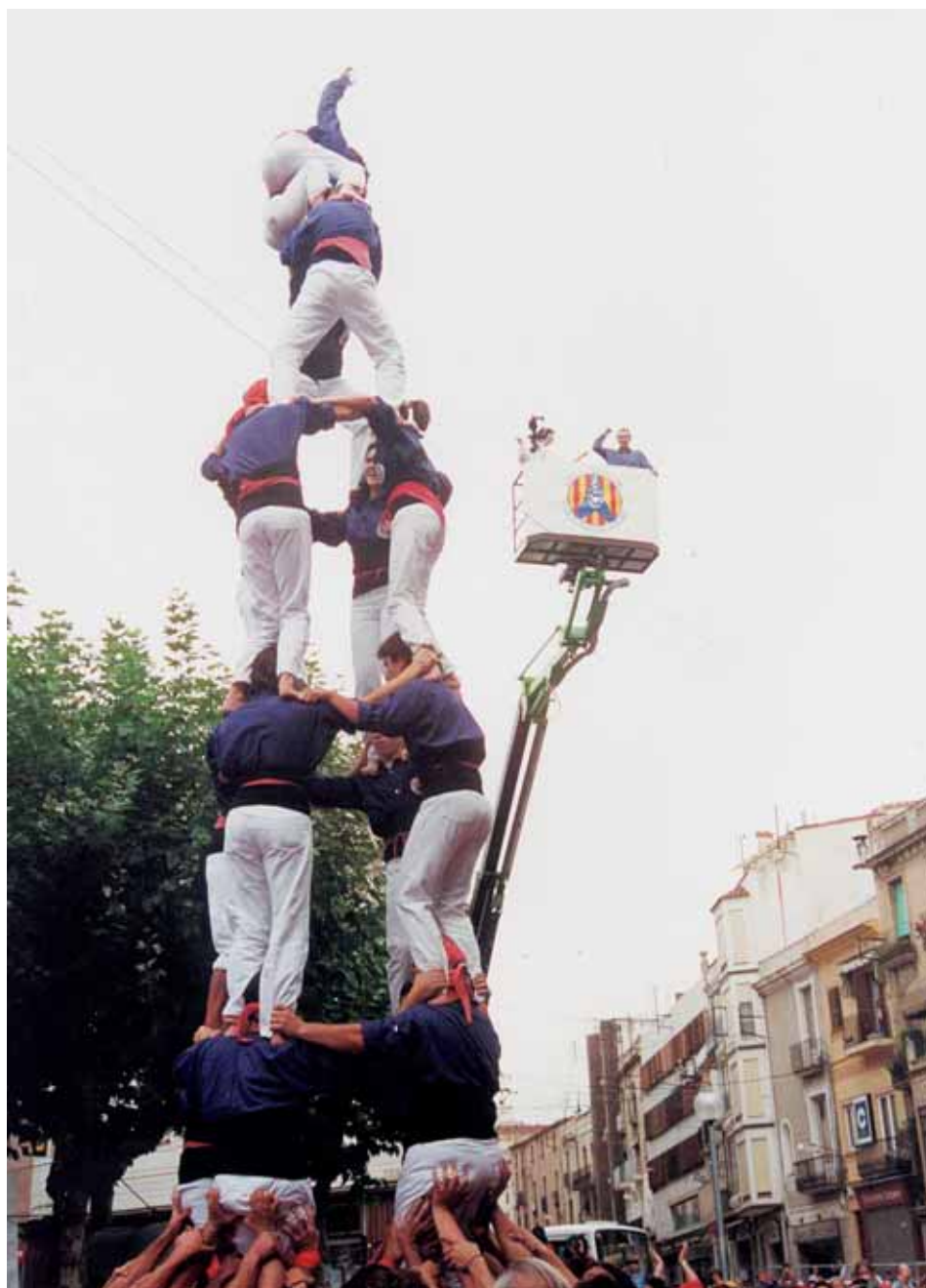
El primer castell de set arribava amb la primera Diada de la Colla (Mataró, 13/10/1996).