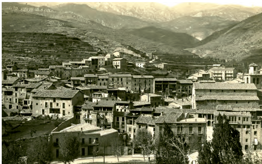
Vista parcial de la Pobla de Lillet entre 1920 i 1930.

amb el seu marit. Però aviat la situació canvia radicalment, perquè Denys Choffat és destinat a la fàbrica que Asland té al Clot del Moro, al Berguedà. De moment, Aurora Bertrana es queda a Barcelona, malgrat que aquesta decisió accentua l'allunyament físic del matrimoni, que inevitablement han d'estar separats durant més temps. És evident que, treballant a més de cent trenta quilòmetres de la Ciutat Comtal, ara sí que a l'enginyer li serà materialment impossible desplaçar-se cada dia fins al seu pis per dinar i fins i tot per dormir. Es veuen poc i a Aurora Bertrana aquesta separació forçada l'entristeix i la fa patir. No cal dir que l'escriptora viatgera se sent feliç quan es retroba amb el marit, per exemple durant les festes de Nadal de 1929, en què Denys Choffat pot passar uns dies a Barcelona. 10