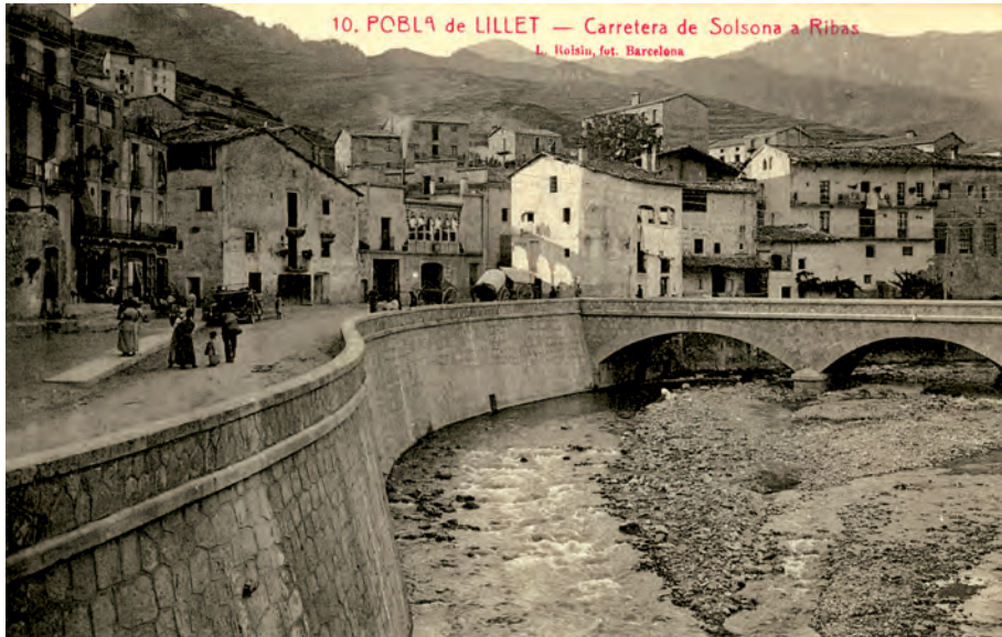
La Pobla de Lillet entre 1920 i 1930.