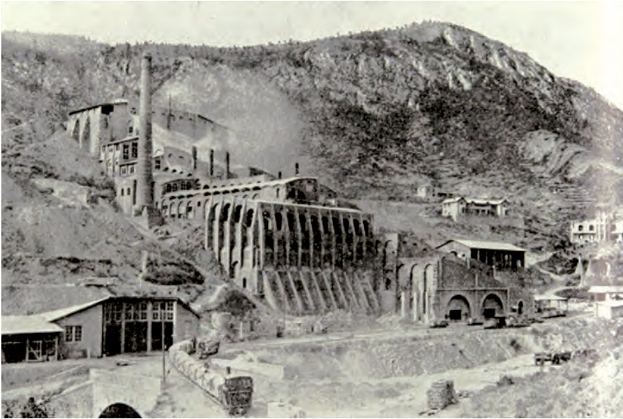
La fàbrica de ciment Asland del Clot del Moro en ple rendiment.

neus. El meu marit a la Pobla. La meva germana pitjor des que és a Puigcerdà. Tot no és alegria en el món. Vaig estar tres setmanes fatal de [?] i mig malalta de fer-ne. 11