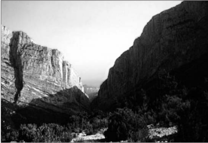
Congost de Mont-rebei

A les parets rocoses de l'altra riba, en època hivernal, podem trobar amb paciència algun exemplar de pela-roques, un ocell de color carmesí que s'enfila acrobàticament per les lleixes de la roca, tot buscant insectes amb els quals alimentar-se.