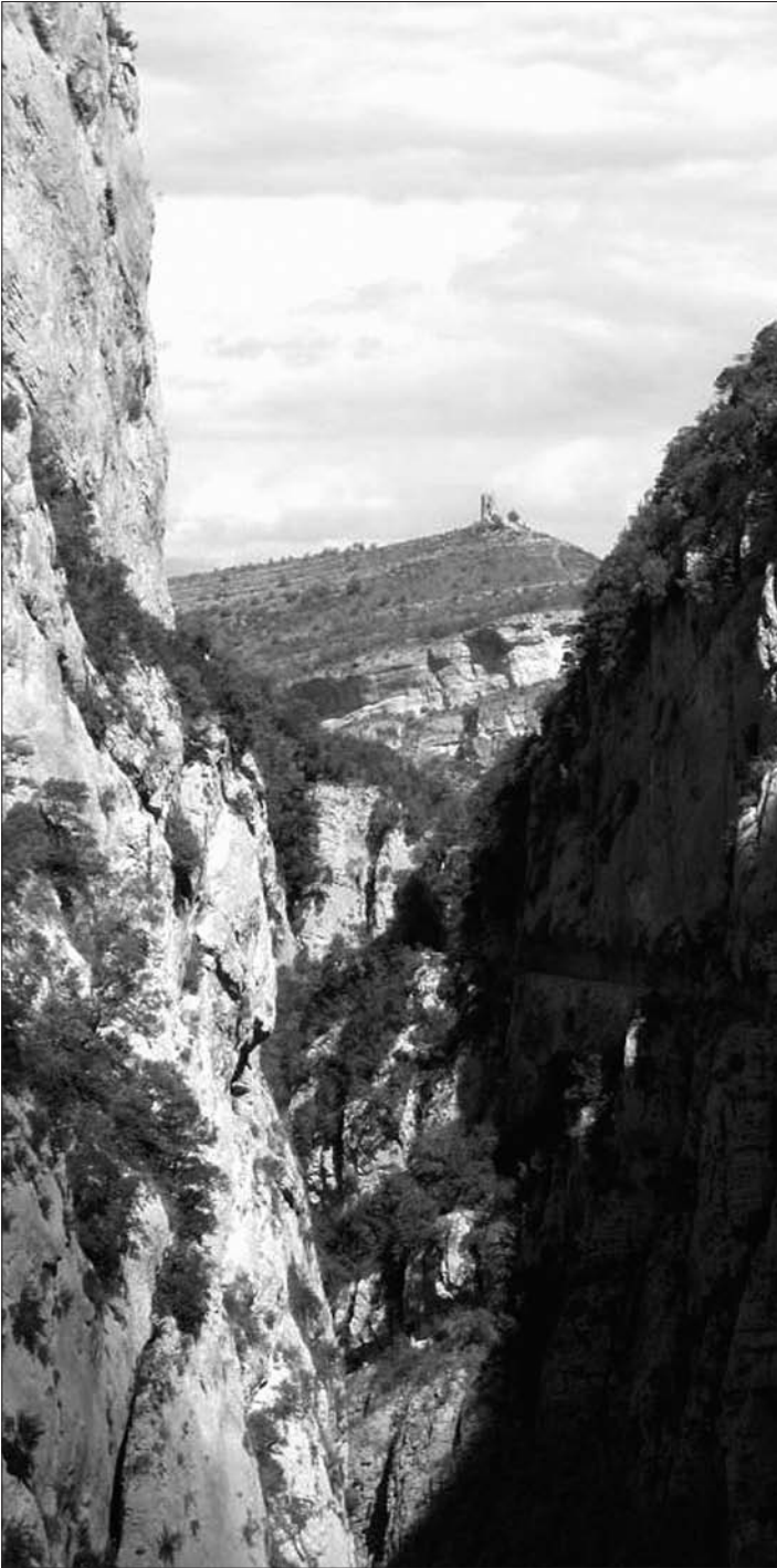
Congost de Mont-rebei