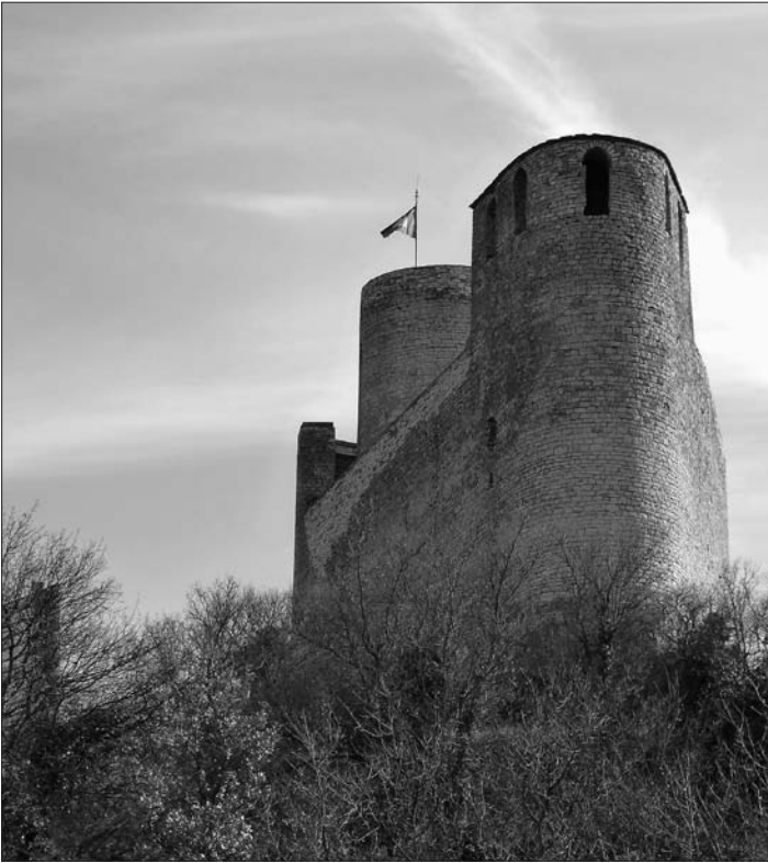
El castell de Mur, des de l'oest

Puigcerçós, d'Orcau i de Llanera (al nord i nord-est).