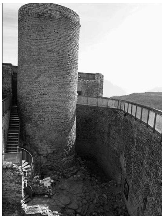
Torre mestra, cos de guàrdia i pas de ronda

L'entrada se situa al sud; avui s'hi accedeix per unes escales, però antigament es feia per una rampa adossada a la paret. La porta, estreta, es podia tancar mitjançant un travesser intern que s'inseria a l'orifici de l'esquerra, desgastat.