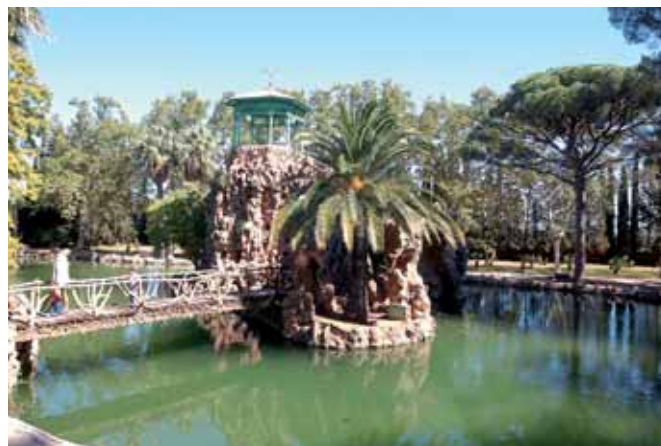
El gran llac i jardins del Parc Samà de Cambrils estan oberts al públic El gran lago y jardines del Parc Samà de Cambrils están abiertos al público

También destacaban por sus gustos exóticos y su comportamiento social. En el inventario de bienes de Miquel Biada,*