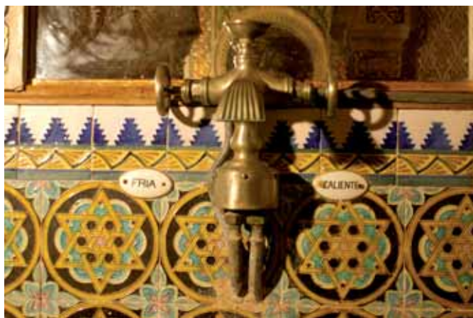
Gran modernitat, disposar d'aigua corrent calenta i freda Gran modernidad, disponer de agua corriente caliente y fría