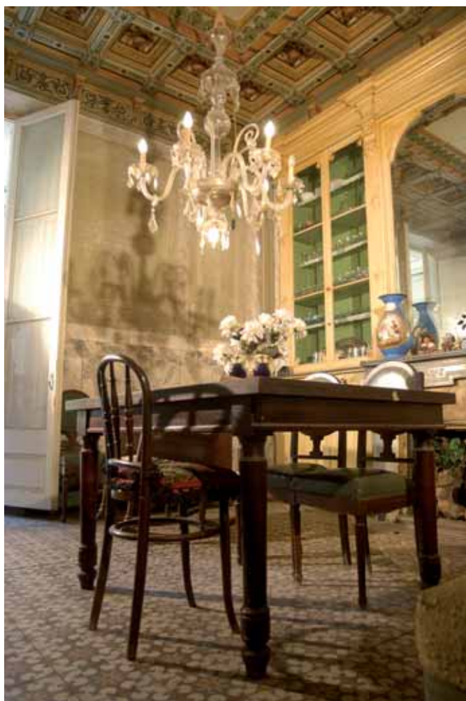
Tant Bonaventura Puig com el seu fill Rogeli van ser alcaldes de Blanes. El primer el 1898 i el segon, del 1939 al 1944