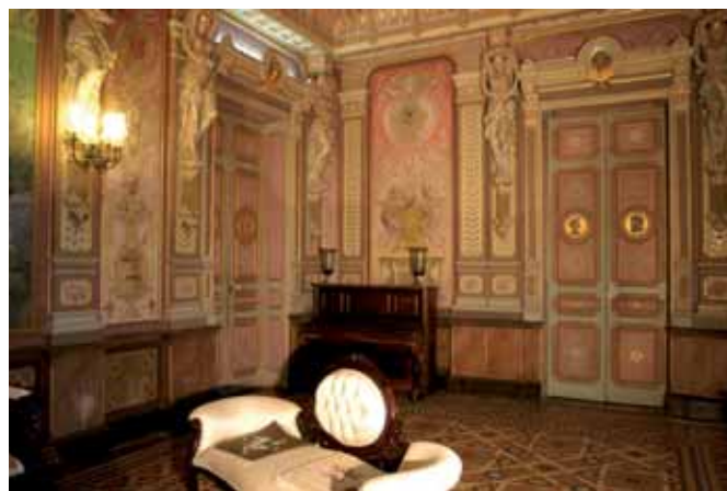
La sala gran del palau de la Plana Novella, a Olivella La sala grande del palacio de la Plana Novella, en Olivella

sa Caleta de Lloret de Mar, es va erigir l'any 1978 un monument als indians pobres, dels quals eufemísticament es deia que "haviem perdut la maleta a l'Estret". 3