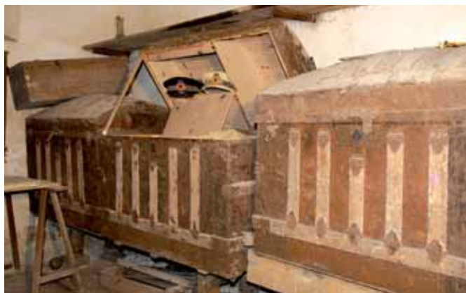
A Can Gallet, la casa de Bonaventura Puig, a Blanes, es guarden els mundos d'anar a Cuba