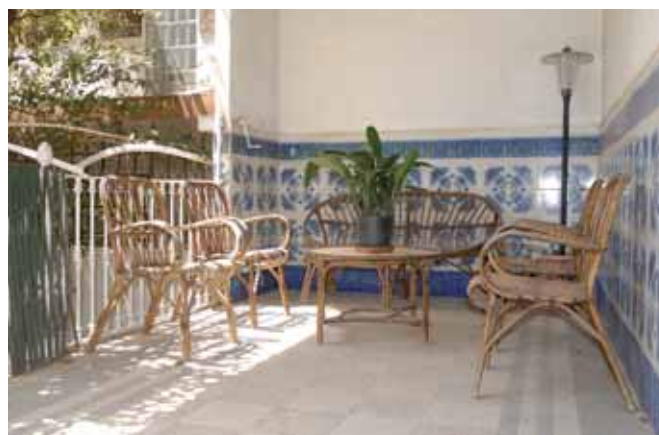
La seva casa amb jardí, Can Gallet, al carrer de l’Esperança 14, és la més luxosa d’aquest carrer d’americanos blanencs

El exotismo que rodeaba a los indianos fue abonado por la literatura y el teatro, a pesar de que no todos ellos se pasaban el día echando de menos el ron y las mulatas ni hablando una melaza lingüística de catalán-cubano como en El depatriat de Rusiñol. 10 Las palabras cubanas que usaban los indianos arraigaron enormemente entre la población del litoral donde se hablaba de las suripantas o las churrianas para designar a las mujeres de mala vida, de los jacarandosos o personas muy alegres o de hacer el chevere para designar a los que se comportaban como un chuleta. 11 El catalán hablado en el otro lado del Atlántico se vio también contaminado. Cuando el comediógrafo Eduard Aulés*, 12 de la escuela de Pitarra , regresó a Barcelona, tras diecisiete años en Cuba, el director de L’Esquella de la Torratxa , Antoni López, le pidió unas líneas para los lectores. Aulés escribía: