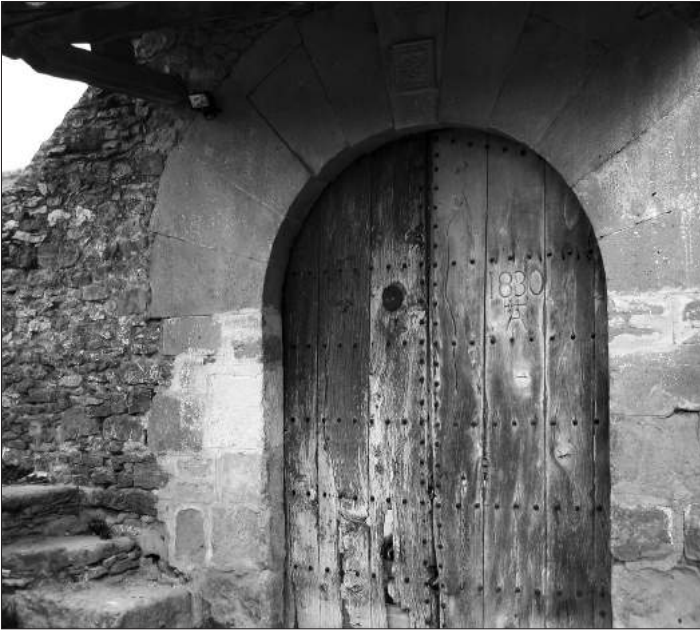
A la llinda del mas de la Talladella s'hi representa la Flor de la Vida

fàcil accés motoritzat, com són Can Sants, Ca l'Aliguer i el mas Blanc, situats al peu de la carretera C-1413 que arriba a Centelles i que neix al revolt de la C-59, al costat del Club de Golf Can Bosc. Cal recordar també que tots els itineraris són circulars, exceptuant els del segon bloc.