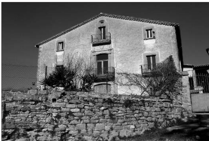
Mas de Bernils