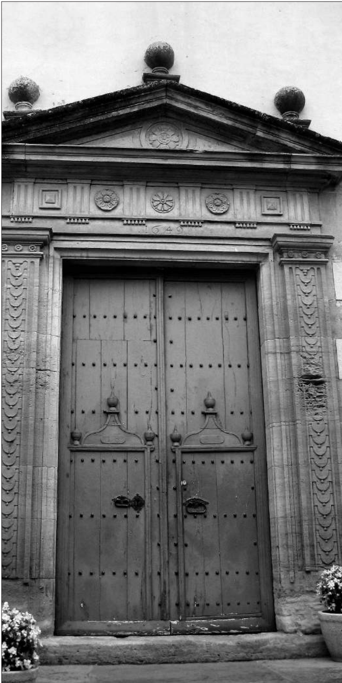
La flor de vuit pètals esculpida a la portalada de l'església de Sant Quirze Safaja