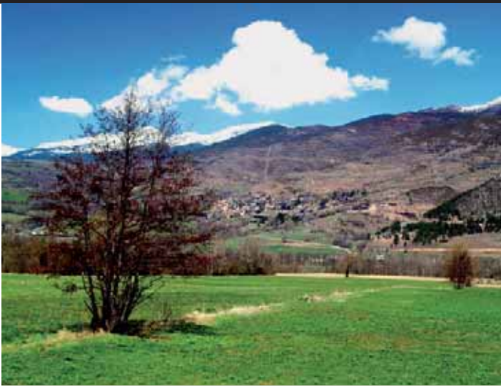
Prullans des del pla de la Batllia

tituïa l'antic poble de Neriniano, que consta en l'acta de consagració de la catedral d'Urgell, de mitjan segle X. Per aquest motiu es coneix també amb el nom de Santa Eugènia de Nerellà. Ben aviat ens reclama l'atenció el campanar inclinat de l'església parroquial, anomenat popularment "la Torre de Pisa de la Cerdanya". Deixem el GR 150 i reculem fins a l'última desviació. Seguim ara la carretera local cap a l'esquerra en direcció a Pi i gaudim d'una vista detallada del pla de la Batllia, amb Bellver al fons i, tancant l'horitzó, el massís del Puigmal. Creuem per un pont estret el mateix torrent que abans hem trobat entre Pi i Olià i arribem a un revolt tancat des d'on surt una pista a l'esquerra.