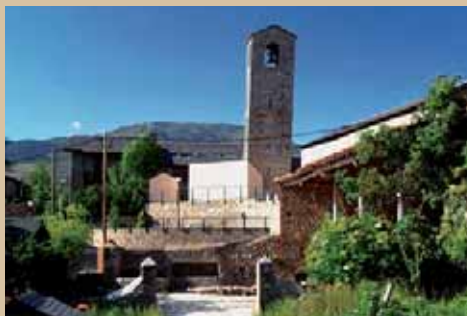
Santa Eugènia i el seu campanar inclinat

Lacusada inclinació d'1,5 m de la seva torre campanar és la singularitat principal d'aquesta església. Es tracta d'un dels tres campanars romànics de la Cerdanya que es conserven sen-