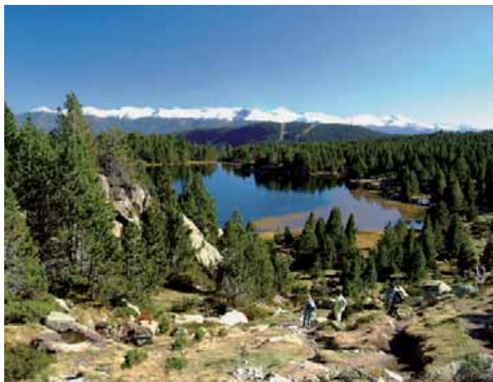
L'estany del Viver, amb el Puigmal i les muntanyes de Núria al fons

L'objectiu de la guia és oferir a qualsevol excursionista, debutant o d'un nivell tècnic mitjà, disset maneres diferents de recórrer a peu la Cerdanya. És com si hi passés disset dies de vacances i volgués aprofitar-los. Aquests disset dies poden ser també disset caps de setmana durant l'any, o disset sortides per a persones que viuen i treballen a la comarca. L'evolució econòmica d'aquests últims anys s'ha transformat en una forta reducció de les feines agrícoles i ramaderes. Això ha comportat que molta gent visqui d'esquenes a la muntanya, quan els seus avantpassats la tenien present —per grat o per força— al llarg de la vida. Hi ha molts cerdans, avui, que desconeixen l'entorn del seu poble. Tot i els dos centres, seria una mentida afirmar que l'ambient excursionista és tan viu a Puigcerdà i Bellver com, per exemple, a Benasc, Torla o Gavarnia, per no sortir dels Pirineus. Ja no parlem de poblacions alpines com Zermatt o Chamonix.