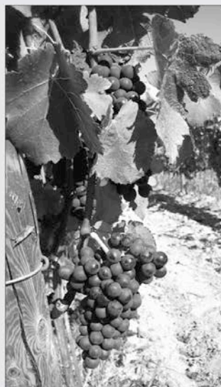
A finals d'agost ja trobem el raïm

Els ceps són de diferents varietats: la Pansa Blanca, la Garnatxa Blanca, la Pansa Rosada, el Pica-poll, la Malvasia, la Parellada, el Macabeu, el Chardonay i el Chenin Blanc, utilitzades per a l'elaboració dels vins blancs. I la Garnatxa Negra i Peluda, l'Ull de Llebre, el Merlot i el Cabernet Sauvignon, utilitzades per elaborar vins rosats i negres.