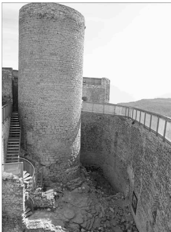
Torre mestra, cos de guàrdia i pas de ronda

L'entrada se situa al sud; avui s'hi accedeix per unes escales, però antigament es feia per una rampa adossada a la paret. La porta, estreta, es podia tancar mitjançant un travesser intern que s'inseria a l'orifici de l'esquerra, desgastat.