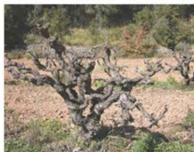
Gambes, xató i vins, tres productes significatius de la comarca

La gamba de Vilanova és un dels productes emblemàtics d'aquesta comarca, que arriben a través del port pesquer local i que nombrosos restaurants adherits ofereixen mitjançant diferents receptes (a l'all cremat, a la parmentier , amb arròs, en suquet i, evidentment, a la planxa).