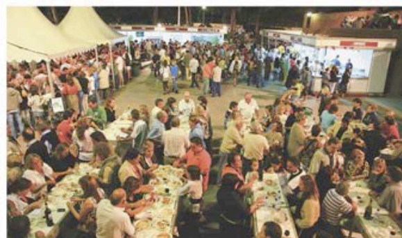
Tast gastronòmic a la Festa de la Verema d'Alella

Alella presenta una oferta considerable. Carrers i espais públics s'omplen de poemes a la primavera amb el festival Espaisdepoesia —normalment a finals de març principis d'abril—, una iniciativa que va néixer amb la voluntat de promoure i difondre la creació literària i convidar tothom a gaudir de la lectura poètica i de la poesia musicada ( www.alella.cat/espaisdepoesia ). Durant el mes de juliol se celebra el Festival d'Estiu, amb concerts de variades propostes musicals a diferents llocs de la població ( www.festivalalella.org ). El segon cap de setmana de setembre té lloc la tradicional Festa de la Verema, que cada any incorpora la presentació dels nous vins dels cellers de la DO, jornades gastronòmiques de tast a l'Hort de la Rectoria amb participació de restaurants de la zona, actes culturals, correfoc, actuacions musicals i visites guiades als cellers, a més de curses de tast ( www.alella.cat/festaverema ).