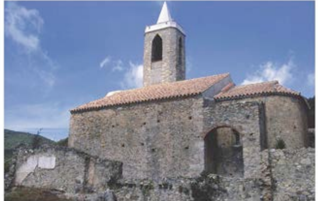
Ermita de l'Erola a Hortsavinyà, al Parc del Montnegre

Trobareu centres i punts d'informació a la Creu de Can Boquet (caps de setmana i festius), a la pista forestal que travessa la serralada, i a Can Lleonart, l'Oficina de Turisme d'Alella.