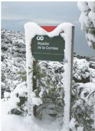
De forma esporàdica la neu també arriba a la Serralada Litoral

Les bones condicions meteorològiques i el terreny fèrtil han afavorit la presència humana constant des d'antic. Els dòlmens neolítics de Castellruf i de la Roca d'en Toni, poblats ibers com el de la Cadira del Bisbe i Cèl·lecs, la vil·la romana de Parpers i el castell medieval de Burriac són alguns testimonis d'aquesta presència.