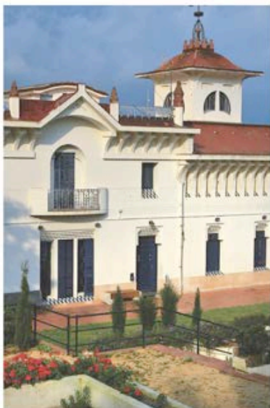
Vil·la Flora a Canet de Mar

Oficina de Turisme de Canet de Mar. Casa Museu Domènech i Montaner. Xamfrà rieres Buscarons i Gavarrà. Tel. 937 940 898. www.canetdemar.cat .