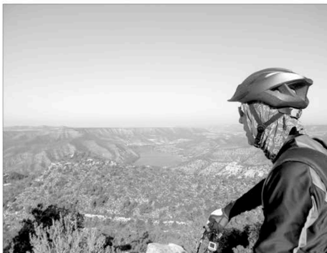
Baixant cap a l'Ebre

km 4,310. Deixem la pista que anàvem seguint, que baixa cap al riu, i girem a la dreta per agafar una pista en més mal estat en direcció a les mines. Al llarg del camí anirem tro-