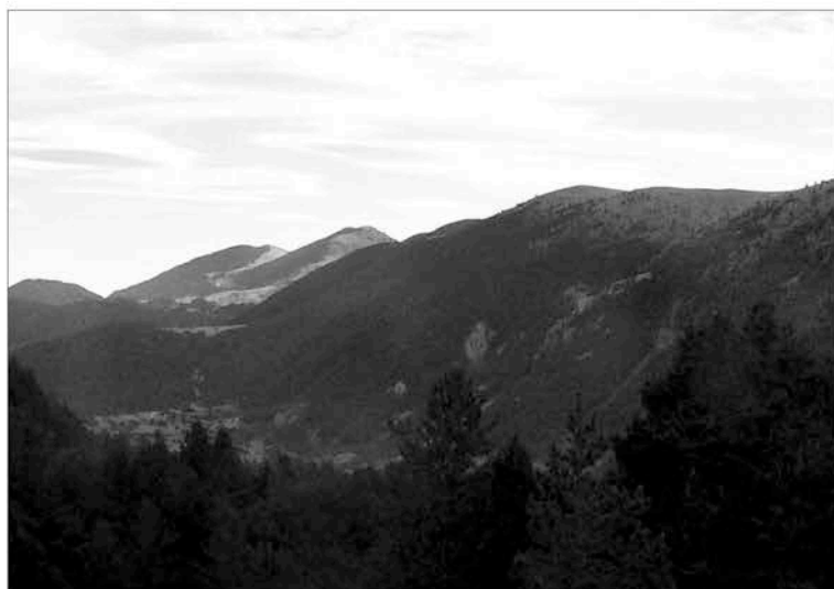
El Montgrony des de la collada de Toses