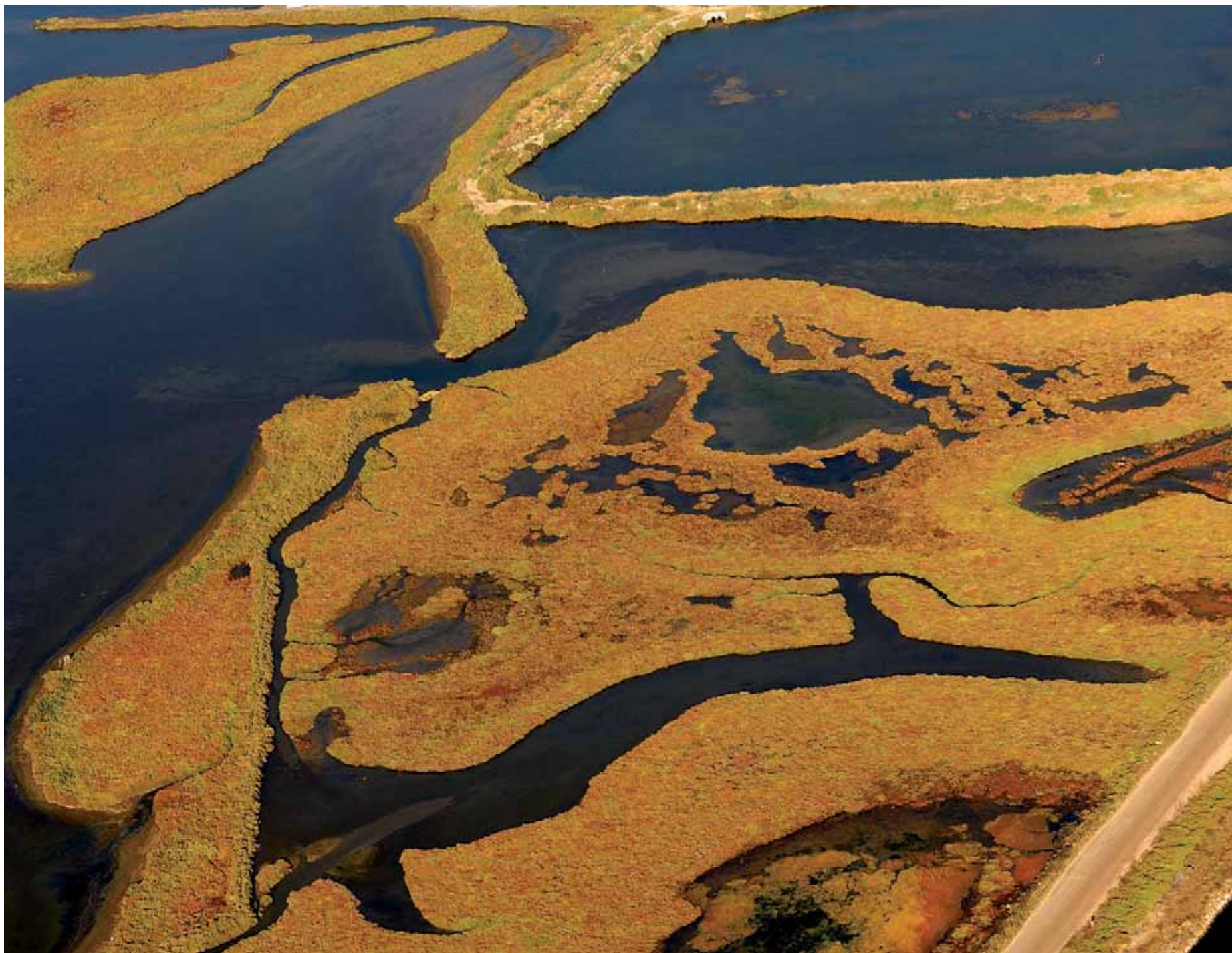
Dibuixos capritxosos, vora la badia dels Alfacs Dibujos caprichosos, junto a la bahía de Los Alfacs Capricious drawings, close to the bay Els Alfacs