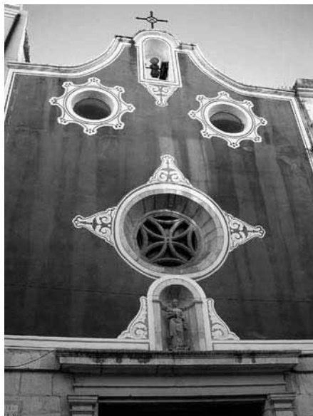
Capella del Roser, al carrer de la Cort.

El carrer de la Cort des de sempre ha estat l'artèria comercial del barri antic i seu de les cases de diverses famílies il·lustres de la ciutat. Existeix des de l'època medieval, quan era la via que enllaçava el castell amb la cort o quadra i ha anat prenent diferents noms segons les circumstàncies socials i polítiques: al segle XII, carrer de la Vilanova 7 i a partir del segle XVI té el nom actual, encara que durant la postguerra fou anomenat carrer de Baldrich. Fixeu-vos en les botigues, en el Centre de Lectura (entitat fundada el 1862), en algunes cases senyoriales i en les diferents plaques commemoratives que indiquen on van néixer l'enginyer naval Andreu Avel·lí Comerma (1842-1917) i el nostre Narcís Oller, a l'edifici que hi havia al número 25. Algunes d'aquestes cases van ser cremades amb les revoltes de l'any 1868, i això féu que tota la família Moragas es traslladés a Tarragona.