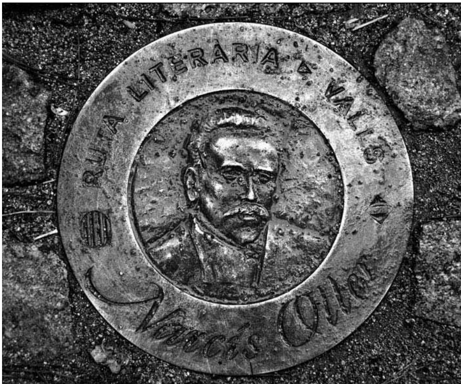
Placa senyalitzadora de la Ruta Narcís Oller al peu del bust de l'escriptor.

El curs 2006-2007 vam presentar la nostra feina als Premis Baldiri Reixac destinats a estimular i promoure l'escola catalana i va obtenir el "Premi a un estudi, assaig o recerca pedagògics", gràcies al qual ha estat possible aquesta edició.