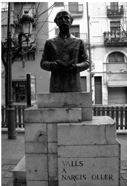
Bust de Narcís Oller, a la plaça del Quarter.

Punt de trobada: plaça del Quarter, davant del bust de Narcís Oller