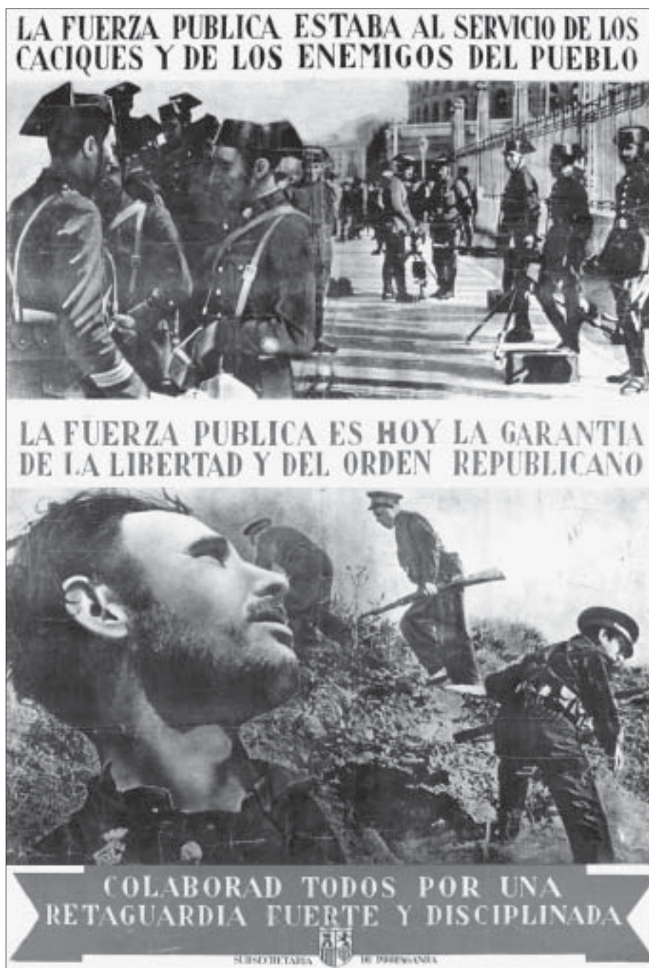
Les forces de seguretat van ser motiu de propaganda durant la Guerra Civil. Aquí, cartell de la Subsecretaria de Propaganda del Govern de la República. AUTOR: ANÒNIM.