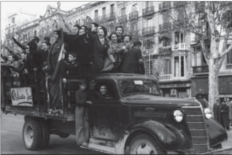
Alguns ciutadans celebren l'arribada de les tropes nacionals a Barcelona el 26 de gener de 1939.

Les autoritats republicanes coneixien l'existència d'aquests grups més o menys autònoms que resistien a les zones «nacionals», però el Govern de Madrid no va tenir mai gaires intencions d'organitzar les bosses de