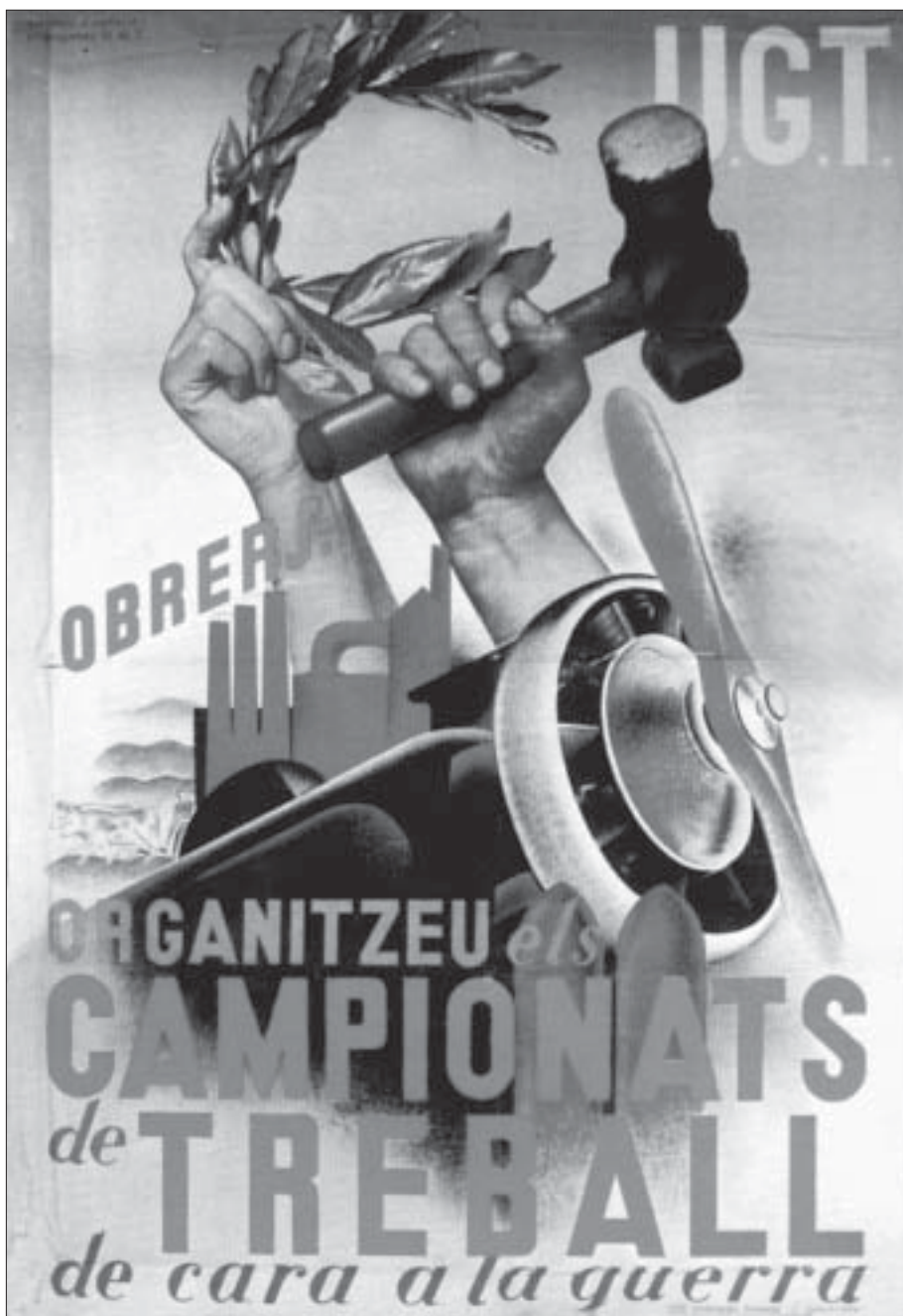
Cartell propagandístic de la UGT de preparació per a la guerra. AUTOR: ANÒNIM.