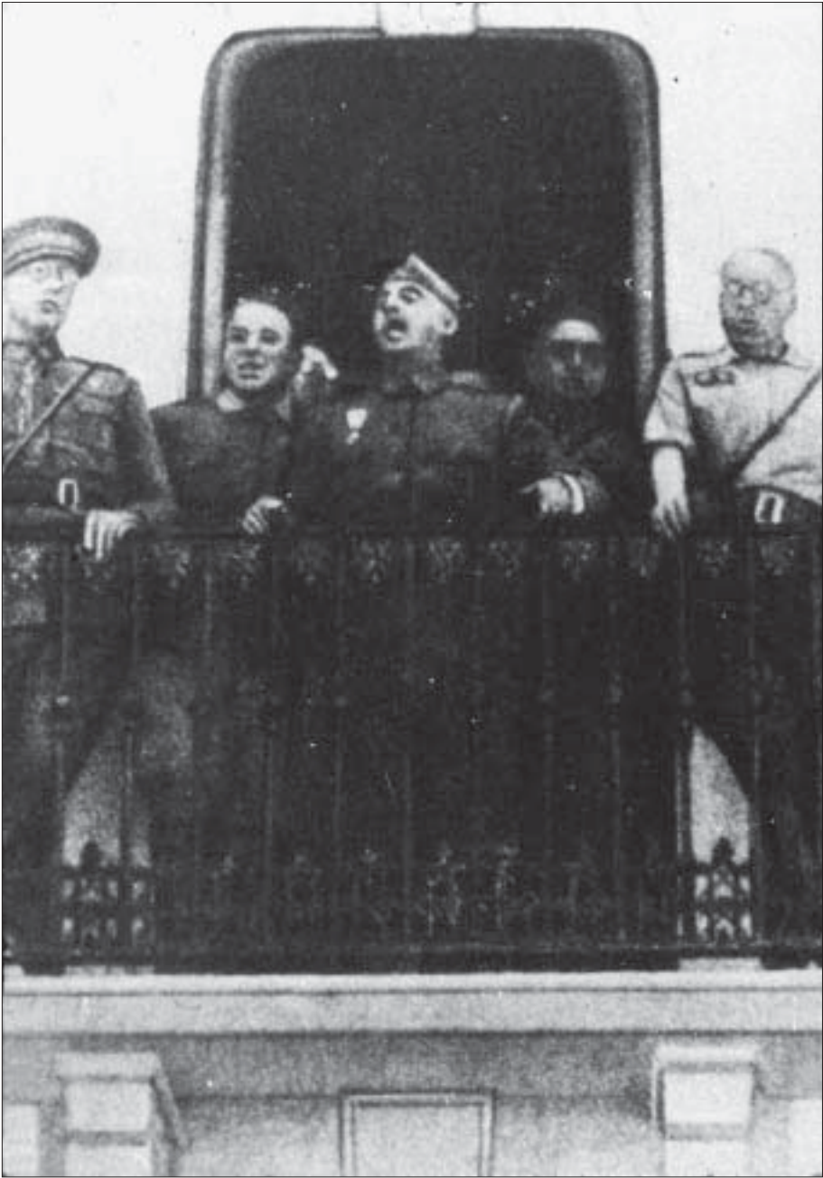
El general en cap de l'Exèrcit de l'Àfrica, Francisco Franco, proclama una «fe cega en la victòria» des del balcó del Govern Militar de Ceuta. És el matí del 19 de juliol de 1936.