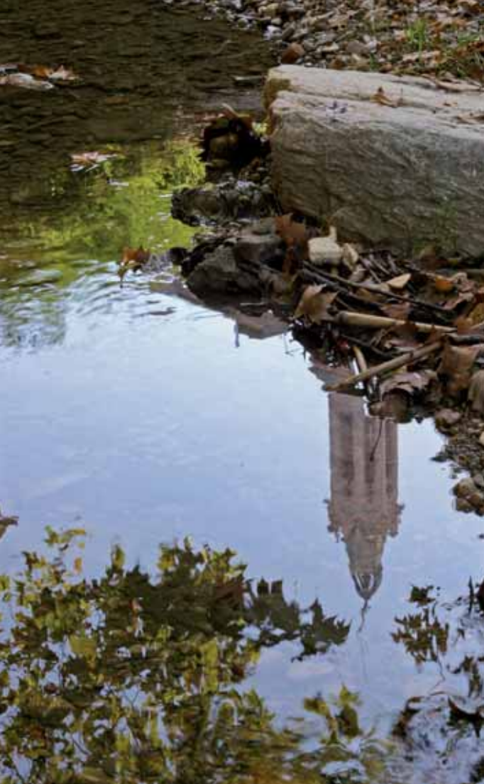
Una suggerent imatge dels torrents de Valls

en els nivells dels aqüífers que determinen en gran part el cabal circulant dels torrents, utilitzat intensament pels regadius agrícoles mitjançant un entramat complex de recs que es remunta a l'edat mitjana.