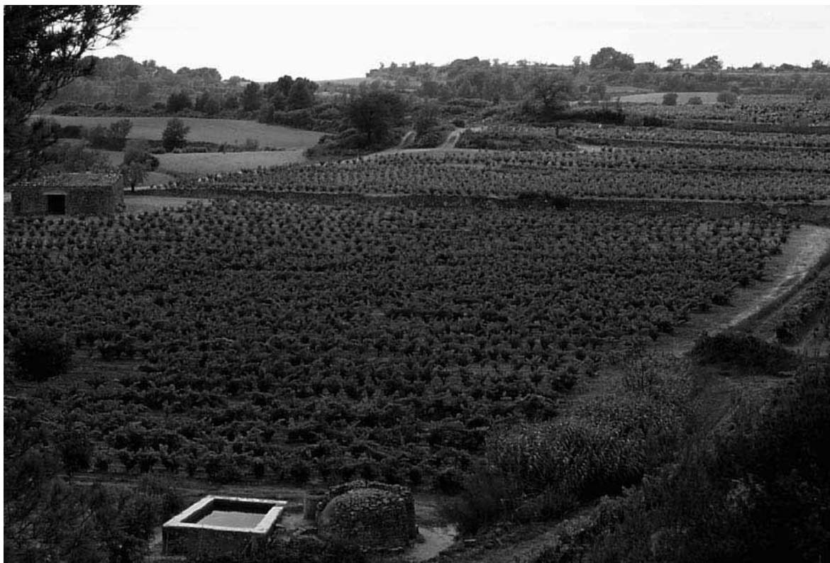
Vinya, pou, bassa, caset i marges (l'Espluga de Francolí)

Tot aquest ampli ventall proporciona una rica mostra de construccions etnològiques mereixedores de ser destacades i catalogades com a patrimoni cultural.