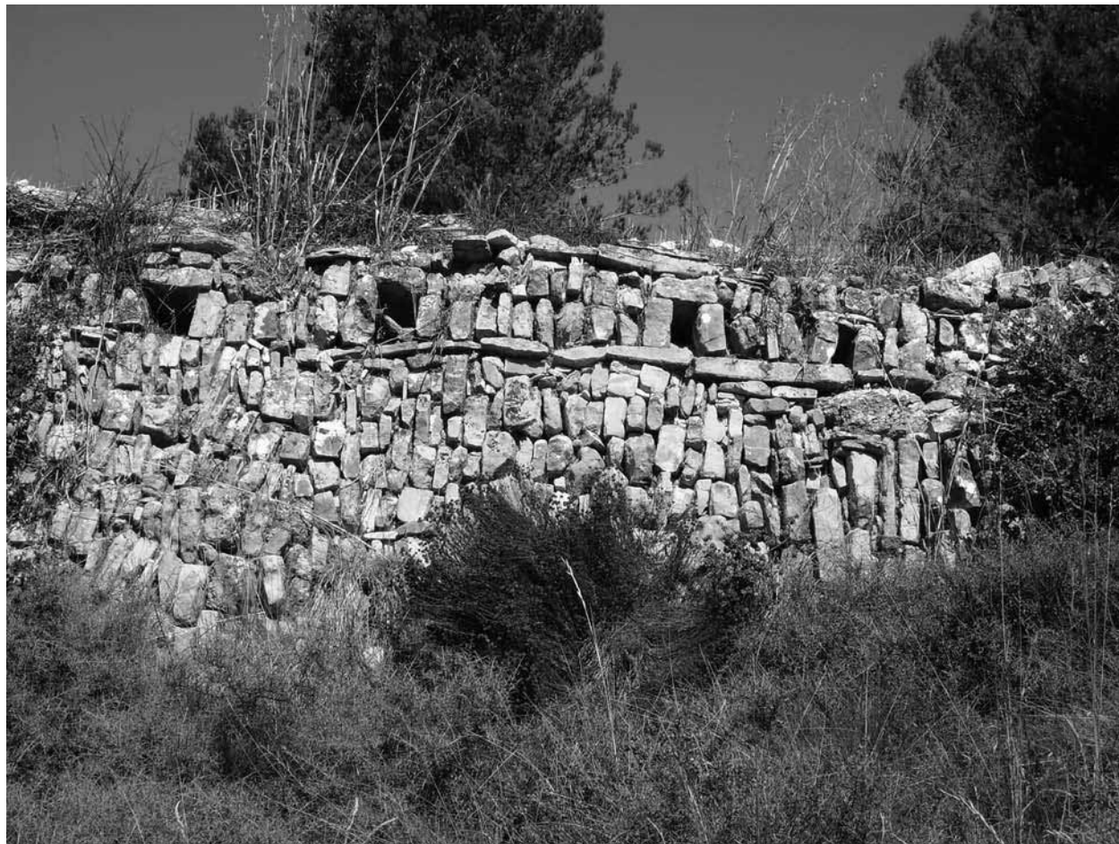
Marge amb forats per desaiguar (Conesa)

per tal d'assentar la terra en aquells llocs on els pendents o l'orografia del terreny ho feia necessari. Sens dubte, devia ser així com es començaren a construir els primers marges amb pedra seca.