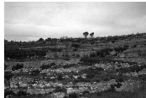
Feixes abandonades (Montblanc)