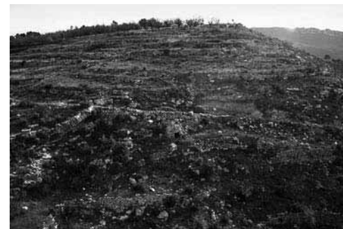
Antigues feixes amb marges (Montblanc)