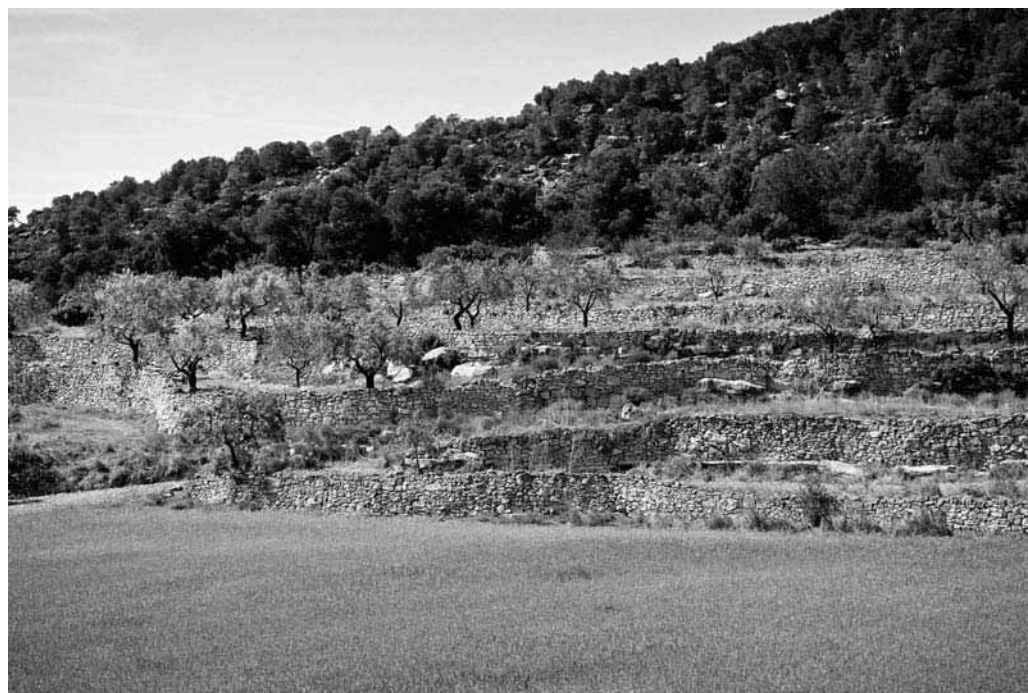
Semrat i feixes amb ametllers (Senan)