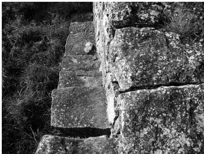
L'Espluga de Francolí