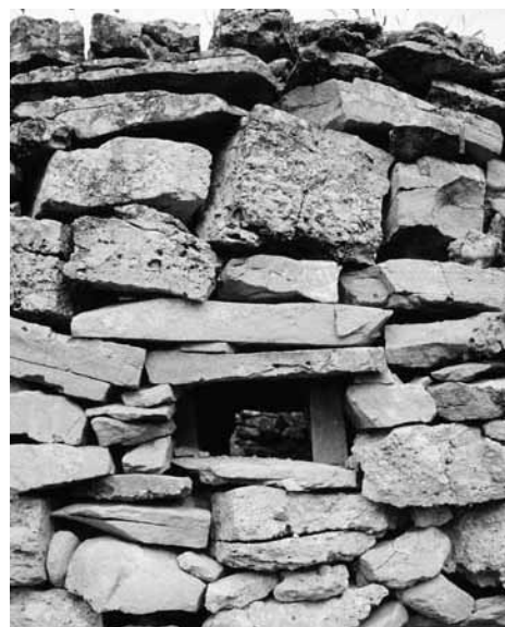
Marge amb una espiellera (Montblanc)

Les més voluminoses eren transportades o arrossegades amb la tirassa 2 i eren les primeres en col·locar-les. Després es continuava amb la resta de pedres, encaixant-les entre elles i falcant-les quan feia falta amb els rebles. 3 Totes servien i eren col·locades sense carejar-les. Amb les més petites es reomplia al darrere. La línia a seguir era normalment