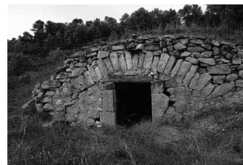
Vimbodí i Poblet