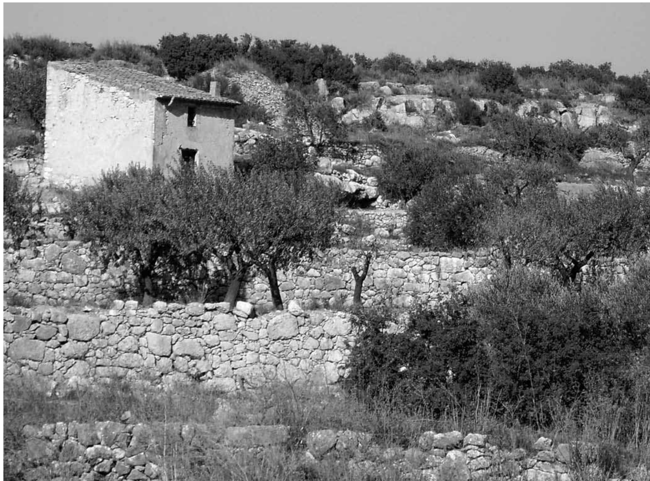
Marges amb ametllers i olivers (Montblanc)

Hem de ser, doncs, conscients que bona part del nostre paisatge actual és fruit de tot aquest procés de canvi i d'aquella tasca realitzada pels pagesos de la comarca, especialment en els darrers 300 anys.