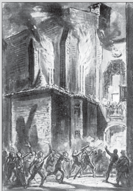
Crema de convents.