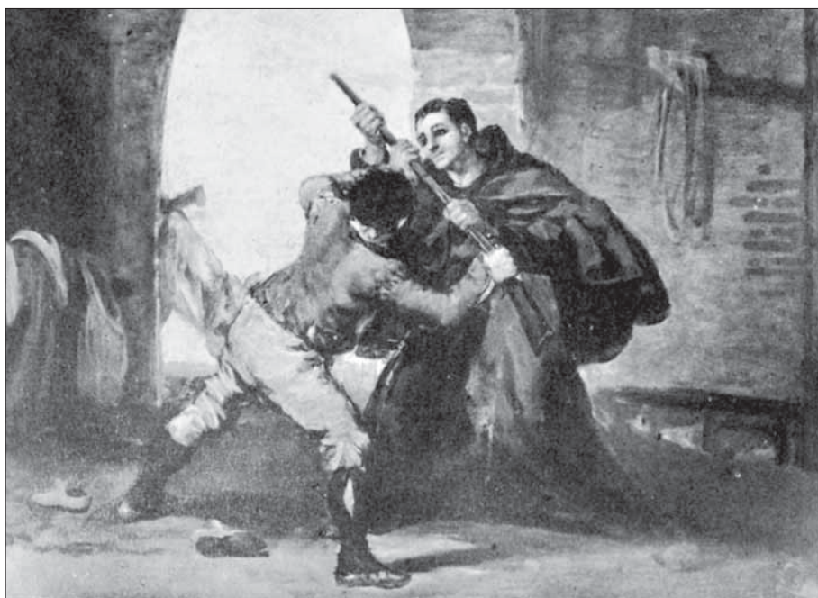
Un frare lluita amb un bandoler, en una obra de Goya.

No hi ha cap dubte que el carlisme és un fenomen molt més complex del que acabo d'exposar, però crec que al costat de les causes socials, polítiques, ideològiques, històriques, econòmiques i religioses que faciliten el sorgiment d'un moviment polític i social com el carlí hi ha raons psicològiques, familiars, culturals i geogràfiques tan importants com les primeres. Només així s'entén la longevitat del moviment, la seva persistència i continuïtat, amb els seus alts i baixos, durant el segle XIX i el XX. S'entén per aquestes raons i per la gran heterogeneïtat dels que hi van participar, des de senyors terratinents fins a les classes més humils i desvalgudes. Els carlins van aglutinar en el seu moment sectors diversos de la societat catalana empesos, uns, pel descontentament amb les noves formes de poder