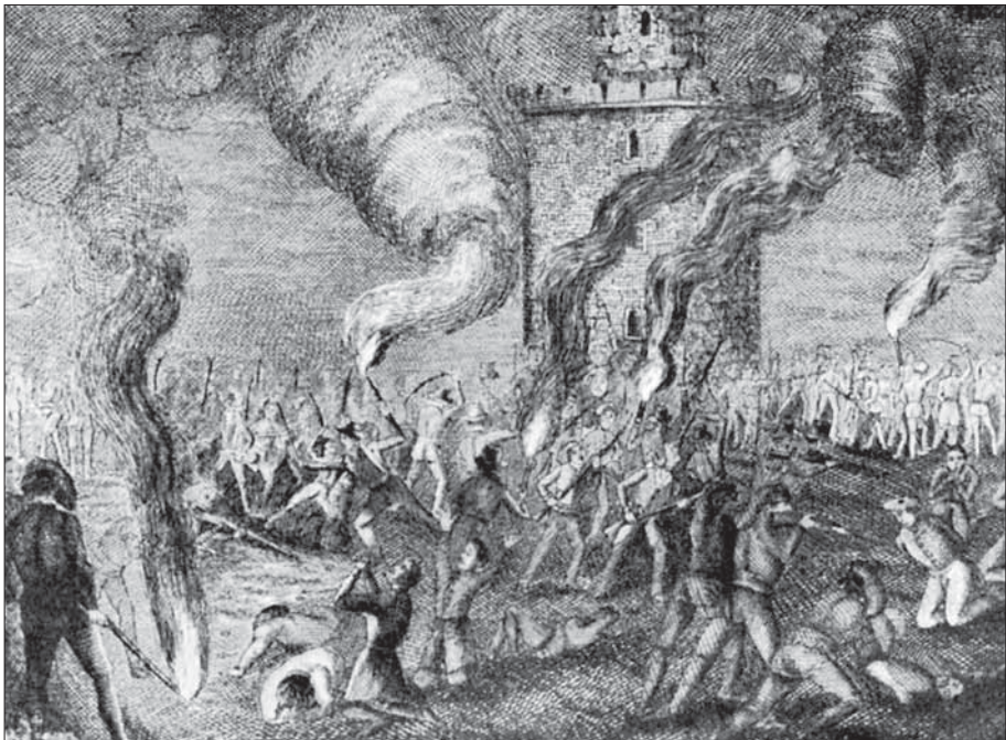
Assalt a la Ciutadella de Barcelona i assassinat de presoners carlins.

La derrota de Santa Maria de Lord no va servir per deturar els carlins. Unes setmanes després de la pèrdua de Lord, van obtenir algunes victòries sonades, com la de la batalla de la masia del Perutillo, a la vall del Segre, prop de Castellnou de Bassella. Els carlins catalans van aconseguir organitzar-se durant tot l'any 1836, però els mancava encara tremp per poder fer-se amb alguna capital important, tal i com van demostrar en els intents frustrats d'ocupar Berga o Prats de Lluçanès. El pretendent, llavors, incapaç d'arreplegar una força com la que havia comandat Guergué un any abans, va enviar el general Rafael Maroto com a comandant suprem de les seves forces. Maroto, però, va topat amb una guerra per a la qual no estava preparat, que l'obligava a córrer dia i nit per les muntanyes trinxant esbarzers i brucs, dormint tot sovint al ras per por a ser encalçat, i fent marrades amunt i avall. A un militar d'acadèmia polit com Maroto, a qui agradaven els elegants moviments de tropes en un camp de batalla, allò li semblava gairebé l'infern i va tornar per on havia vingut creuant la frontera per anar a petar un altre cop a Navarra.