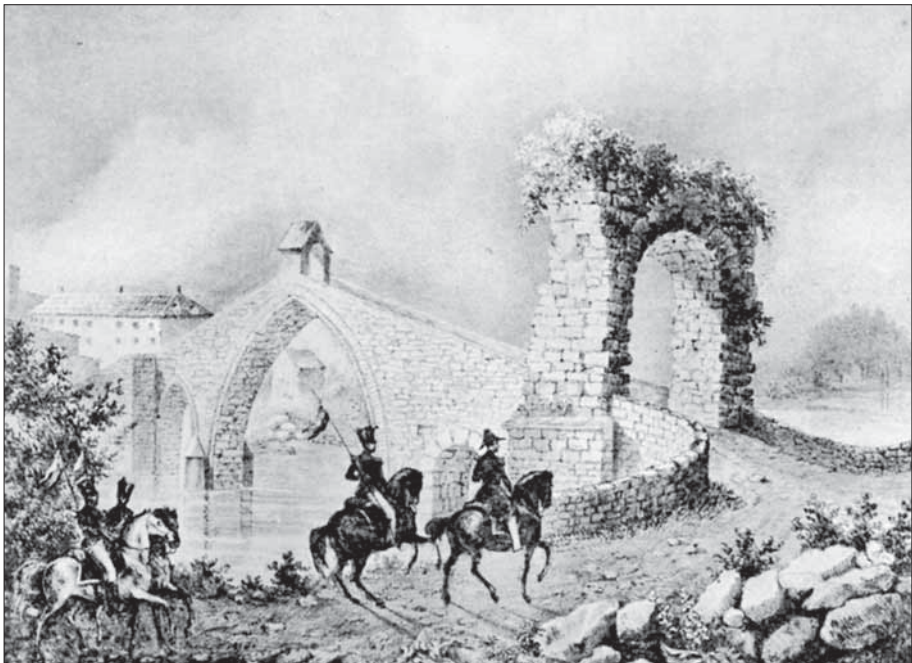
Una patrulla liberal travessa el pont de Martorell.

mitjans materials. Va ser una guerra marcadament civil que, en el cas de Catalunya, va dividir poblacions i famílies i que, com tots els conflictes civils, va provocar una violència interna d'ultratges, venjances i crims. Al llarg de tota la guerra, els carlins mai no van demostrar prou força, ni van disposar de prous mitjans, ni de suport internacional i social per poder fer operacions d'envergadura que els permetessin arribar a Madrid i coronar al seu pretendent Carles. Als carlins, els faltava una cosa que sí que tenien els liberals, l'aparell de l'estat, amb una maquinària ben greixada que permetia recollir impostos, disposar d'un funcionariat més o menys fidel, d'un exèrcit estable i del reconeixement internacional. Tot i aquests avantatges, als quals cal sumar el domini de les principals ciutats i artèries de comunicació de la península, els liberals es van mostrar incapaços de posar fi a la revolta. El resultat va ser, com hem dit, una guerra llarga que es va acabar en fals i que va deixar la llavor plantada per a conflictes posteriors.