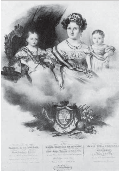
La reina Maria Cristina amb les seves dues filles, Isabel i Maria Lluïsa.

arribar a ocupar la Seu d'Urgell i hi van establir l'anomenada regència d'Urgell en nom del rei Ferran, tot i que de forma provisional, perquè de seguida foren expulsats per les tropes governamentals dirigides pel general Espoz y Mina. Aquests reialistes, els nostres futurs carlins, van col·laborar amb les tropes franceses dels Cent Mil Fills de Sant Lluís en el restabliment de la monarquia absoluta i van constituir el nucli dels anomenats voluntaris reialistes, una mena d'exèrcit paramilitar destinat a perseguir i aixafar possibles brots revolucionaris. A aquests anomenats voluntaris, molts dels quals ho eren a la força, els semblava que el rei Ferran i la seva política eren massa tous, i van començar a constituir-se en un nucli de pressió ultraconservadora dins del mateix règim. Aquests tradicionalistes veien l'infant Carles, un home molt religiós i conservador, com la persona ideal per ocupar el tron.