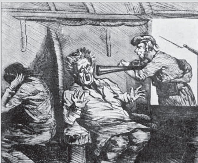
Un grup de trabucaires assalta un tren durant la Tercera Guerra Carlina.