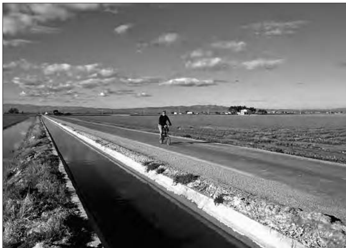
Ja de tornada, cap a Sant Jaume d'Enveja

La tornada la feu per la carretera que va al costat del canal de la dreta. Té poc trànsit, però cal vigilar. Un cop a Sant Jaume,