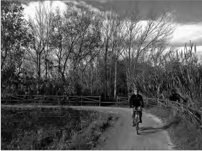
Pel bosc de la Comandanta

deixeu el trencall que hi entra saltant el canal i seguiu recte fins a una bifurcació. Llavors preneu el trencall de l'esquerra, que desemboca a la TV-3404, a l'alçada de la cooperativa arrosse- ra. Aneu a l'esquerra fins al final. Aneu a l'esquerra de nou per la TV-3405; al tercer camí que surt a la dreta, ample, asfaltat i amb un indicador que diu "Ranxo Gran", gireu a la dreta. Després d'una llarga recta, el camí tomba a la dreta; poc després ho fa a l'esquerra (deixant el camí que surt recte) i aviat se li incorpora un caminó per l'esquerra. Aneu de front vers la llacuna de la Tancada. Quan hi sigueu, gireu a la dreta i poc després a l'esquerra (és el camí principal) fins a desembocar al càmping La Tancada. Agafeu la carretera a la dreta i, al cap de dos quilòmetres, arribeu al Poblenu, després de completar una volta perimetral a l'hemidelta dret de l'Ebre.