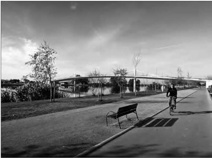
Pel passeig fluvial a tocar de lo Passador

i botigues de records. Deixeu-ho tot enrere i, abans de sortir a la carretera, agafeu el camí ciclista (Caminos Naturales del Ebro) que hi passa pel costat i que us mena a la rotonda que heu creuat a l'anada. A l'esquerra sortiu de nou al passeig fluvial, que ara heu de recórrer fins després de lo Passador. Retorneu a l'Ecomuseu tot desfent el trajecte per dins del nucli urbà de Deltebre; així coneixereu el poble.