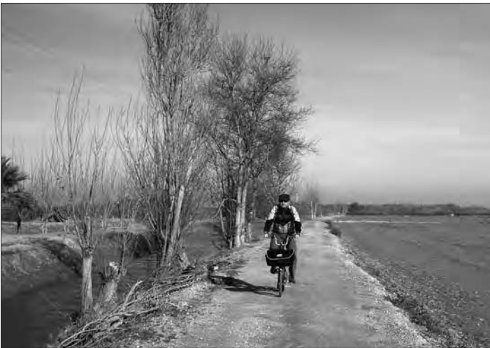
Pedalant cap a la bassa del Canal Vell

Al final del passeig comença la ruta del Garxal; al fons es veu el far. És qüestió de seguir els camins traçats, passant primer per l'aguaitador sobre la llacuna, fins a arribar de nou al riu, just on desemboca. L'agafeu a contra corrent, en direcció al port fluvial i a la zona de les golondrines, on hi ha alguns restaurants